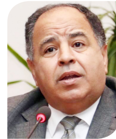
الدكتور محمد معيط وزير المالية

بدء تطبيق نظام الفاتورة الإلكترونية على 134 شركة