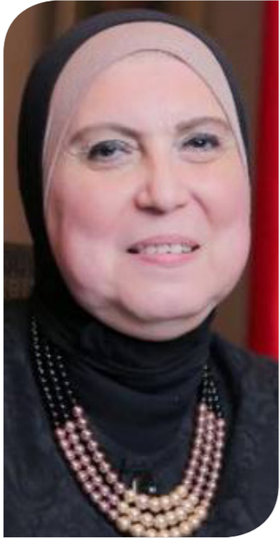
نيفين جامع وزيرة التجارة والصناعة

خلال لقاء مسؤوليها مع وزيرة التجارة والصناعة