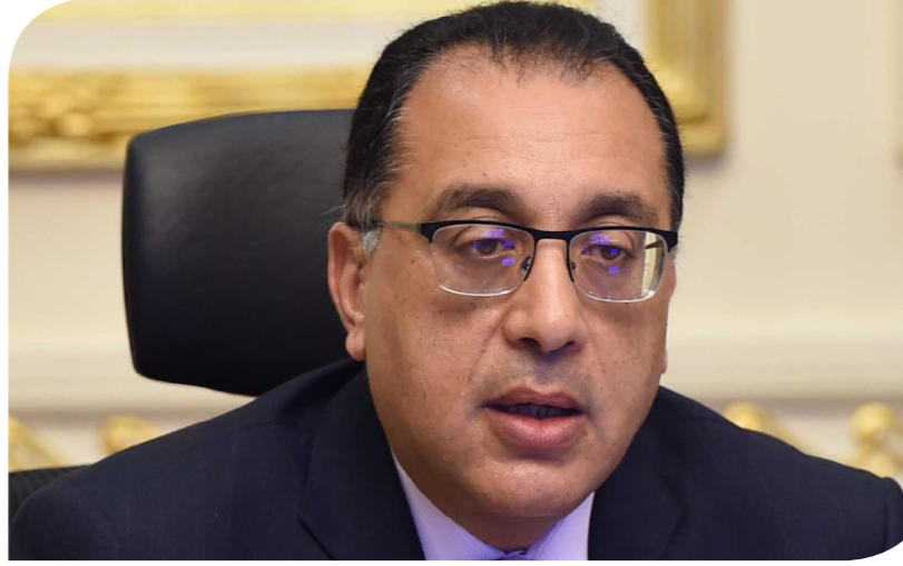
الدكتور مصطفى مذهبولى رئيس مجلس الوزراء

وفي الإجازات والأعياد الرسمية لتغلق الساعة 12 منتصف الليل، وتكون مواعيد فتح المطاعم والكافيهات بما في ذلك الموجودة بالمولات التجارية يومياً من الساعة 5 صباحاً حتى 1 صباحاً، مع استمرار خدمة التيك أواي للمطاعم والكافيهات على مدار 24 ساعة.