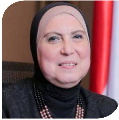
الدكتورة نيفين جامع وزيرة التجارة والصناعة

التنفيذية التي تتم ارتباطاً بدعم الأنشطة الصناعية وتحفيز الصناعة على المستوى الوطني، بما يعكس بصورة إيجابية على أداء القطاعات الصناعية ذات الأولوية والتغلب على أبرز العقبات التي تواجهها، وذلك بالتنسيق مع مختلف الوزارات والجهات المعنية، بما فيها إجراء التعديلات التشريعية اللازمة على اللوائح والقوانين الحاكمة للأنشطة الصناعية، ومراجعة آليات الحصول على الموافقات والترخيص الصناعية. وتابع: وأيضاً تعزيز عمليات الاستثمار الصناعي في الأنشطة الإنتاجية ذات الصلة بتوفير احتياجات السوق المحلية من مستلزمات الإنتاج الأولية والسلع الوسيطة، وكذلك دعم الأنشطة الصناعية المرتبطة بعمليات التصدير، إلى جانب تشجيع الأنشطة الصناعية للمشروعات المتوسطة والصغيرة ودعمها في الاقتصاد الرسمي، وتيسير عمليات توفير المواد الخام اللازمة للصناعة.