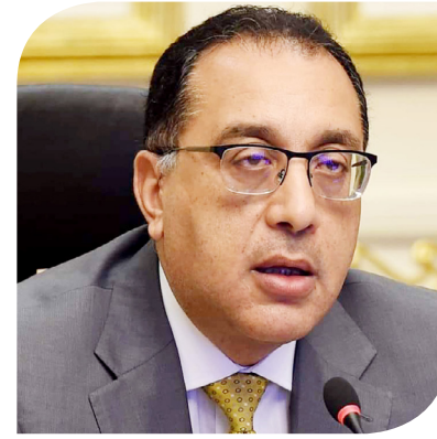
الدكتور مصطفى مديبولي رئيس مجلس الوزراء