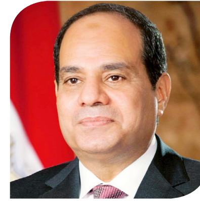
الرئيس عبد الفتاح السيسي

التكنولوجيا الصناعية الحديثة في المجالات ذات الأولوية بالشراكة مع كبرى الشركات العالمية ذات الخبرة العريقة بما يضمن استدامة واستقرار توظيف تلك الصناعات داخل مصر على المدى الطويل. وأضاف المتحدث الرسمي باسم رئاسة الجمهورية أن الرئيس وجه أيضاً بتطوير منظومة المدارس الفنية الصناعية المختلفة ورفع قدرات العاملين بها، وذلك بالشراكة والتعاون مع القطاع الخاص، ودعمًا للتخصصات الصناعية في القطاعات المختلفة التي تصب في صالح خطط التنمية الشاملة في مصر. وعرضت وزيرة التجارة والصناعة أهم نتائج الجولة الخارجية التي أجرتها مؤخراً إلى عدد من الدول العربية والآسيوية والإفريقية، فضلاً عن الترتيبات الجارية لإقامة الجناح المصري في معرض إكسبو دبي 2020، والذي سيضم عرضاً للقطاع السياحي، وكذلك القطاعات الاقتصادية الكبرى والمشروعات القومية التي تبنتها مصر