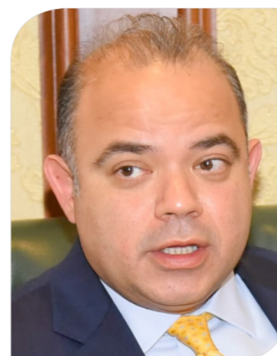
الدكتور محمد فريد صالح رئيس البورصة المصرية

بشأن التأثير المحتمل للضريبة على الطروحات المقبلة سواء التابعة لبرنامج الطروحات الحكومية أو القطاع الخاص لعرضها على مسؤولي وزارة المالية والأطراف المعنية بالسوق. وعن الشركات الصغيرة والمتوسطة، أكد رئيس البورصة، أن هناك زيادة شهدتها مشاركة الأفراد في الشركات الصغيرة والمتوسطة، خلال الفترة الماضية، كما أن هناك عملية تطوير قامت بها البورصة لتلك الشريحة من الشركات، مشيراً إلى إجراء إعادة هيكلة والنظر إلى التجارب العالمية التي سبقتها في التعامل مع تلك الشريحة من الشركات. وأكد أن إدارة البورصة لا تتردد في عمليات الإصلاح ووضعت خطة تنفيذ، كما فرضت التعاقد مع الرعاة والهدف من ذلك أن الشركات تدخل صغيرة ثم تنمو لتتحقق هدفاً للبورصة في زيادة رؤوس الأموال، وتم تشكيل ٢ لجان مع بنوك مثل مصر والأهلي