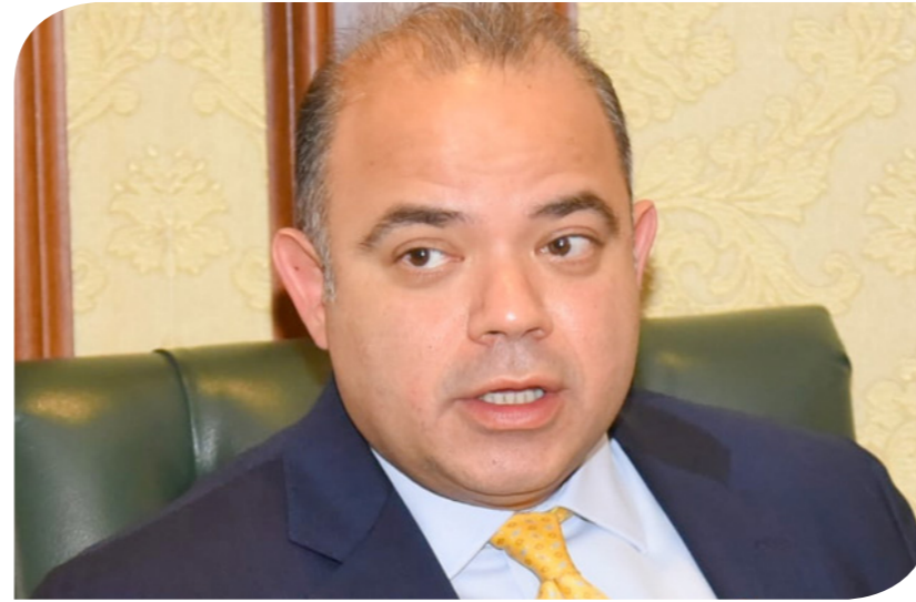
الدكتور محمد فريد، رئيس مجلس إدارة البورصة المصرية

أجنبية وبنوع الخيارات الاستثمارية أمام جميع فئات المستثمرين. ووفقاً للبيان، تضمنت التعديلات المقترحة استحداث مادة جديدة 8 مكرر والتي تنظم عملية قيد أسهم الشركات المصرية ذات غرض الاستحواذ، وذلك تماشياً مع أفضل الممارسات العالمية في هذا الشأن. وتجزئ المادة المستحدثة قيد أسهم الشركات المصرية التي يكون غرضها الوحيد هو الاستحواذ، على أن ينص نظامها الأساسي على أن حصيلة زيادات رؤوس الأموال تستثمر في أوعيه ادخارية ذات عائد ثابت ومجنبة لدى متلقي الاكتتابات لحين الاستحواذ، وأنه وفي حال عدم القيام بعمليات استحواذ خلال سنتين من تاريخ القيد سوف يتم رد الأموال للمستثمرين بالعائد المحقق