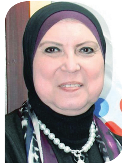
نقيب جامع وزيرة التجارة والصناعة

بدأ صندوق تنمية الصادرات في مراجعة المستندات الخاصة بنحو 950 شركة ضمن ثاني دفعات المرحلة الثالثة من مبادرة السداد الفوري، التي أطلقت الحكومة أول مراحلها في نوفمبر من العام الماضي. وقالت مصادر على صلة بالملف إنه يجري حالياً التفاوض مع وزارتي البترول والكهرباء على المستحقات الخاصة بهما لدى تلك الشركات لاعتمادها فيما سيتم صرفه نهاية الشهر الجاري وخصمها من القيمة التي ستصدر للشركات، مشيرة إلى أن القيمة المبدئية للمستحقات المطلوبة وفق المستندات المقدمة تتراوح بين 1.5 إلى 2 مليار جنيه. وأشارت إلى أنه من المتوقع أن تصل القيمة الإجمالية لشهادات الصرف بالمرحلة الثالث إلى نحو 20 مليار جنيه.