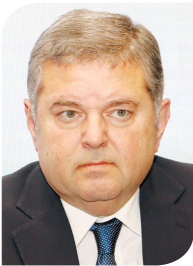
هشام توفيق وزير قطاع الأعمال

الرأسمالية، قال إن "هناك خطأ كاملاً في هذا الأمر"، موضحاً أنه مقترح خرج من السوق نفسها، وتحديداً من الجمعية المصرية للأوراق المالية (إكما)، وتمت مناقشته لإقناع وزارة المالية والحكومة به. وقال: "أنا كنت وسيطاً في هذه العملية، والمقترح مقدم من خبراء السوق لأنه أكثر عدالة بمراحل من ضريبة الدمغة". وعما إذا كانت الدولة المصرية ماضية في تطبيق الضريبة مطع جيدة وستتري السوق وتوسع قاعدة ملكيته، مشيراً إلى تجهيز مجموعة أخرى من الشركات ببعضها كبرى للطرح بعد يونيو 2022. ورداً على تساؤل حول عدم اطمئنان السوق لملف ضريبة الأرباح