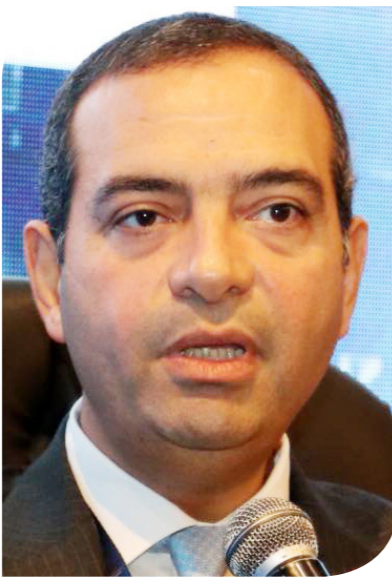
أيمن سليمان المدير التنفيذي لصندوق مصر السيادي

المنطقة المناسبة. وأكد مدير صندوق مصر السيادي، أن منطقة باب العزب منطقة أثرية، وتتميز بأنها ليست منطقة أثرية بالكامل ولكن متاح فيها أماكن تصلح لتنفيذ عمليات بناء مختلفة، بشرط أن تتناسب مع المنطقة، موضحاً أنه سيتم الانتهاء من الدراسة الخاصة بخطة تطوير منطقة القاهرة التاريخية خلال شهر ونصف. وأوضح أن الصندوق تسلم مجمع التحرير منذ عدة أشهر فقط وانتهى من عمليات دراسة المبنى بالكامل، مشيراً إلى أنه خلال أيام سيتم الإعلان عن التحالف الفائز بالمشاركة في عمليات تطوير المجمع، وذلك بعد تلقي عدد من العروض.