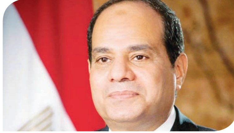
الرئيس عبدالفتاح السيسي