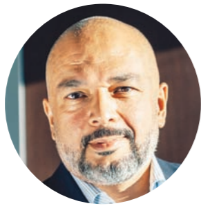
حازم متولي الرئيس التنفيذي لشركة اتصالات مصر