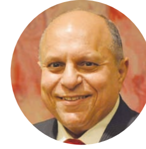
هاني محمود وزير الاتصالات وتكنولوجيا المعلومات الأسبق