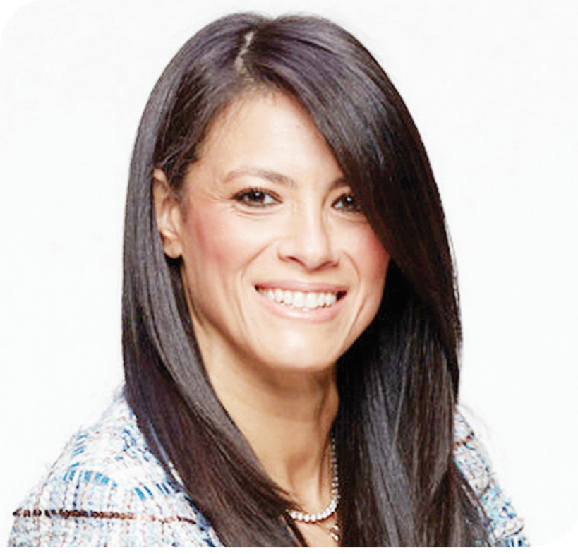
الدكتورة رانيا المشاط وزيرة التعاون الدولي

وأكدت أن التمويلات تسهم في مشروعات متعددة من بينها تطوير خطوط مترو الأنفاق وتنفيذ المشروع القومي للطرق وتحديث خطوط السكك الحديدية، مؤكدة أن دور الوزارة لا يقتصر على الاتفاق على التمويل لكن المتابعة الدقيقة في