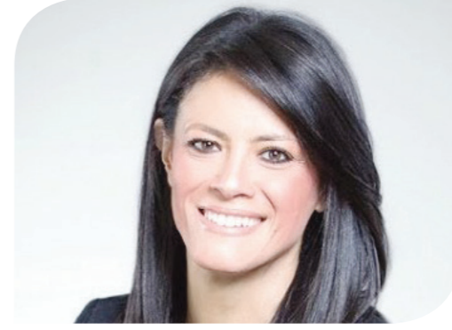
رانيا المشاط وزيرة التعاون الدولي