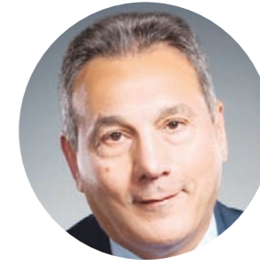
محمد الإتربي رئيس مجلس إدارة بنك مصر