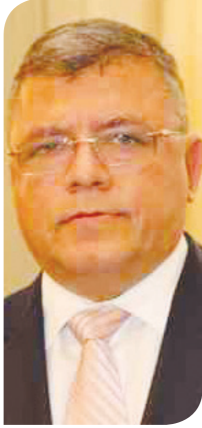
خالد نجم وزير الاتصالات وتكنولوجيا المعلومات الأسبق

ولفت إلى أن الميزة الأساسية في شبكات الجيل الخامس تتمثل في التعامل الذكي بين الأجهزة والماكينات وبعضها البعض، وأن التطبيق الأكثر وضوحاً سيكون في المدن الذكية، لافتاً إلى أن خدمات الجيل الرابع لم يتم استغلالها بشكل كامل حتى الآن في مصر، وأرجع السبب في ذلك إلى أن حجم الترددات التي تمت إتاحتها لهذه التكنولوجيا لم يكن كافياً، مؤكداً أن خدمات الجيل الخامس مفيدة للمؤسسات بشكل أوضح كثيراً من استخدام الأفراد، وأنها تحتاج إلى أضعاف ترددات الجيل الرابع.