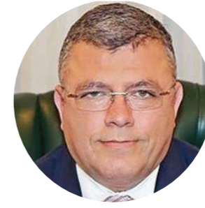
خالد نجم وزير الاتصالات وتكنولوجيا المعلومات الأسبق