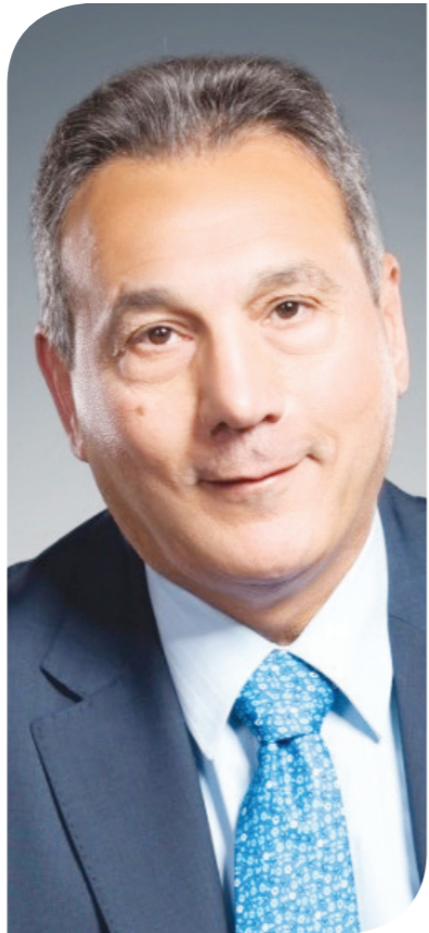
محمد الإترابي رئيس مجلس إدارة بنك مصر