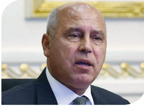
كامل الوزير وزير النقل