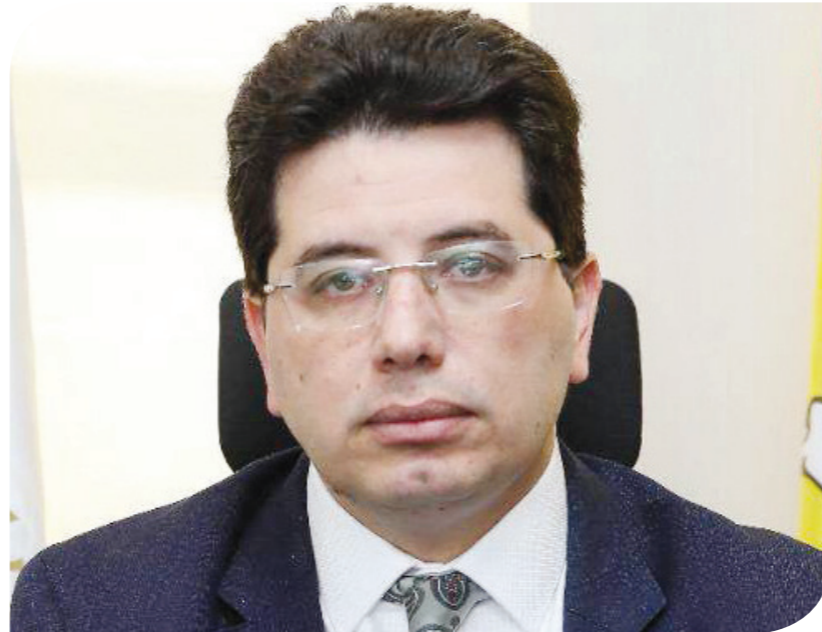
إيهاب نصر وكيل محافظ مساعد البنك المركزي للعمليات المصرفية ونظم الدفع

ويحسب تصريحات سابقة لمسؤولي البنك المركزي، فإن القواعد المنظمة لإنشاء البنوك المتخصصة والتي تشمل بنوكاً رقمية، ومشروعات صغيرة ومتوسطة، ومدفوعات، ستحدد الحد الأدنى لرأسمالها وحجم تلقائها للودائع وبعض الضوابط الأخرى.