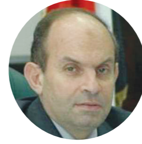
عمرو بدوي الرئيس التنفيذي الأسبق لجهاز تنظيم الاتصالات