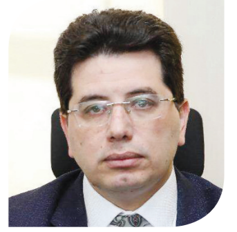
إيهاب نصر وكيل محافظ مساعد البنك المركزي