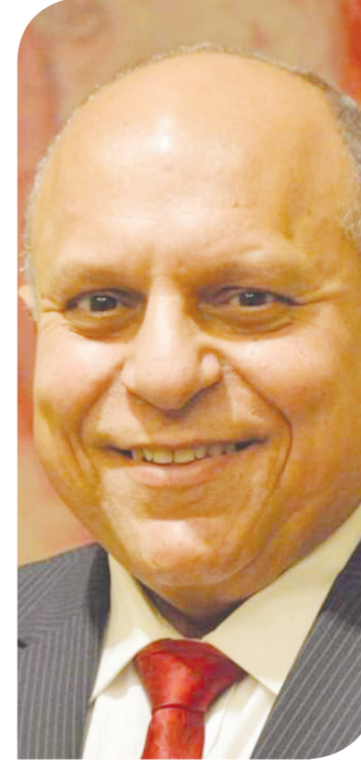
هانى محمود وزير الاتصالات وتكنولوجيا المعلومات الأسبق

ونوه إلى أن مصر قفزت بشكل كبير في ترتيب الدول من حيث سرعة وجودة الإنترنت خلال الأعوام القليلة الماضية، وقال: «صحيح أننا لم نصل إلى مصاف الدول المتقدمة، ولكننا شهدنا طفرة حقيقية»، متوقفاً استمرار تقدم مصر بشأن هذا الملف خلال الفترة المقبلة.