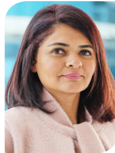
مونيبت دوس محلل الاقتصاد الكلي وقطاع البنوك بشركة إنش سي

وقالت: "تلاحظ أن المجموعة المالية هيرميس كانت هدف استحواذ لرجل الأعمال نجيب ساويرس في عام 2014 الذي قدم عرضاً للاستحواذ على 20% من أسهم الشركة بسعر 8.84 جنيهاً للسهم -تم التعديل في ضوء التغير في عدد الأسهم من 2014 حتى الآن-، مما يعني مضاعف ربحية يبلغ 17.1 مرة لعام 2014 ومضاعف قيمة دفترية 1.0 مرة". وأشارت إلى أنه في ذلك الوقت، قِيم المستشار المالي المستقل للمجموعة المالية هيرميس (IFA) السهم عند 12.7 جنيهاً مصرياً للسهم -تم تعديله أيضاً- أي بمضاعف ربحية للسهم في 2014 يبلغ 24.4 ومضاعف قيمة دفترية 1.43. وبناءً على ذلك، نصحت إدارة الشركة المساهمين بعدم قبول العرض. وأوضحت أنه بالنظر إلى معاملات الاندماج والاستحواذ الأخرى المشابهة التي حدثت خلال عام 2021، نجد أن بنك ABC