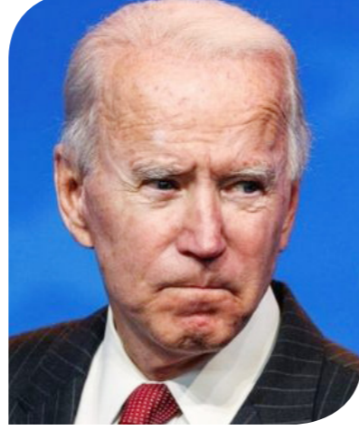
الرئيس الأمريكي جو بايدن

المشاكل التي نعيشها حالياً". وقال وزير الخارجية الأوكراني ديمتري كوليب، إن كييف ستدافع عن نفسها وتنتصر، ويمكن للعالم أن يوقف بوتين ويجب عليه فعل ذلك، حان وقت التحرك. من جانبه، تعهد الرئيس الأمريكي جو بايدن، بأن "العالم سيحاسب روسيا واصفاً العملية العسكرية بأنها "هجوم غير مبرر". وقال بايدن في بيان إن الرئيس بوتين شن حرباً مخططاً لها ستتسبب بمعاناة وخسائر بشرية كارثية. وأعلن أن الولايات المتحدة وحلفاءها سيردون على العملية العسكرية الروسية بطريقة