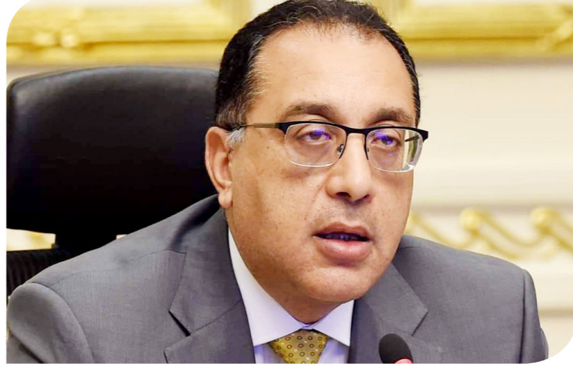
الدكتور مصطفى مدبولي رئيس مجلس الوزراء

وعرض وزير التعمين، الدكتور علي المصليحي، مستويات أسعار السلع المختلفة عالمياً، وخطط الوزارة لتوفير مخزون استراتيجي من هذه السلع. واستعرض الاجتماع أيضاً التداعيات المحتملة للأزمة على أسعار البترول، خاصة في ظل صعود أسعاره نتيجة للظروف الاقتصادية التي يمر بها العالم في مرحلة