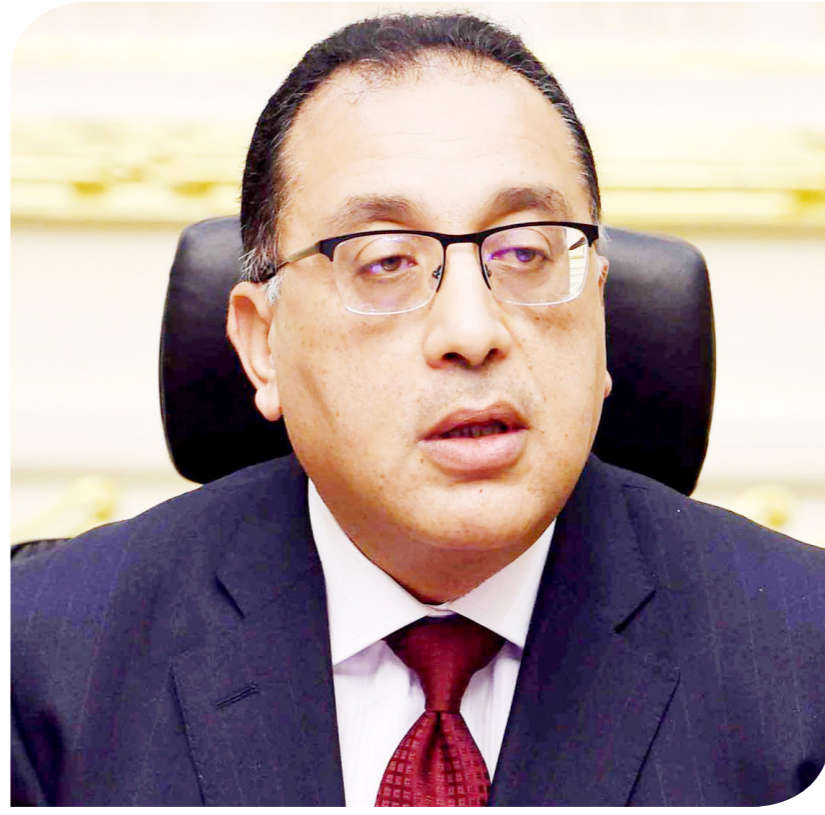
الدكتور مصطفى مدبولي رئيس الوزراء