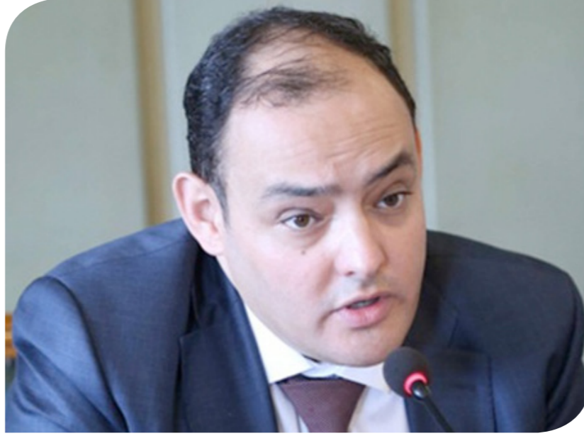
المهندس أحمد سمير وزير التجارة والصناعة

وأوضح رئيس الوزراء أن الأزمة التي يمر بها العالم حالياً، يقدر صعوبتها، إلا أنها في الوقت نفسه تعد "فرصة لنا، خاصة إذا اهتمنا بقطاع الصناعة، وما يتعلق بتعميقه وتوطين العديد من الصناعات، وسعيًا لزيادة حجم الصادرات". وأكد ضرورة إعداد كل غرفة من غرف اتحاد الصناعات ورقة عمل وخطة تنفيذية متكاملة يتم عرضها في المؤتمر الاقتصادي، وصولاً لإقرارها، وتنفيذ محتوياتها على الفور. وأكد الدكتور مصطفى مدبولي،