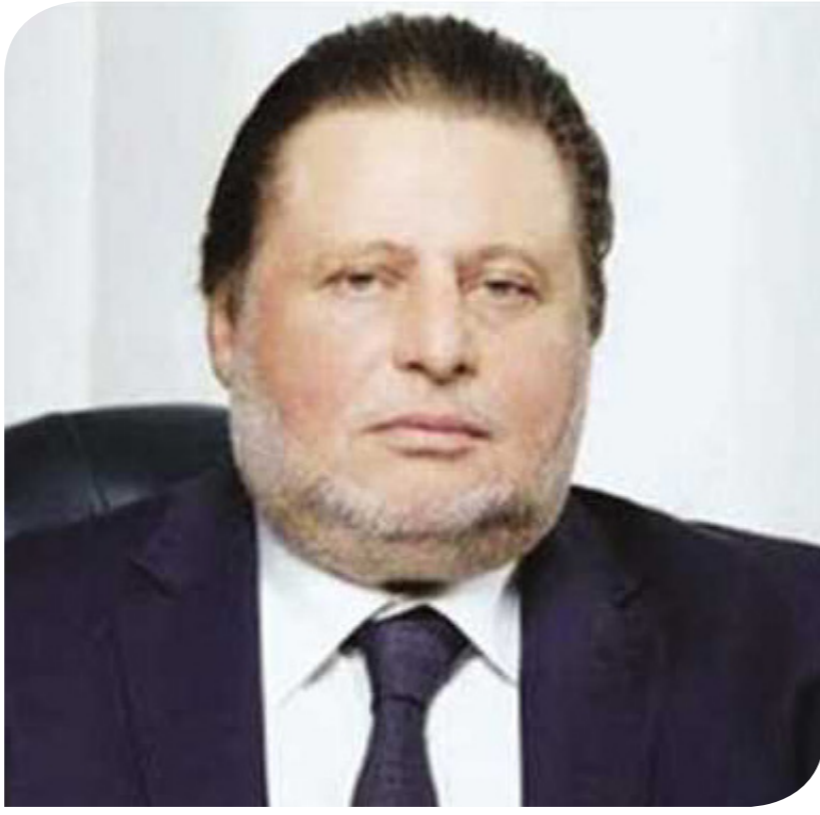
حسن عبد الله محافظ البنك المركزي

وقال السفير نادر سعد، المتحدث الرسمي باسم رئاسة مجلس الوزراء، إن اللقاء استعرض عدداً من الأطر والمجاور التي ستم مناقشتها وطرحها خلال انعقاد المؤتمر الاقتصادي، الذي كلف الرئيس السيسي، الحكومة بالإعداد له؛ بحيث يتم خلال جلساته مناقشة المقترحات والرؤى التي من شأنها دعم مختلف قطاعات الاقتصاد المصري، وسبل