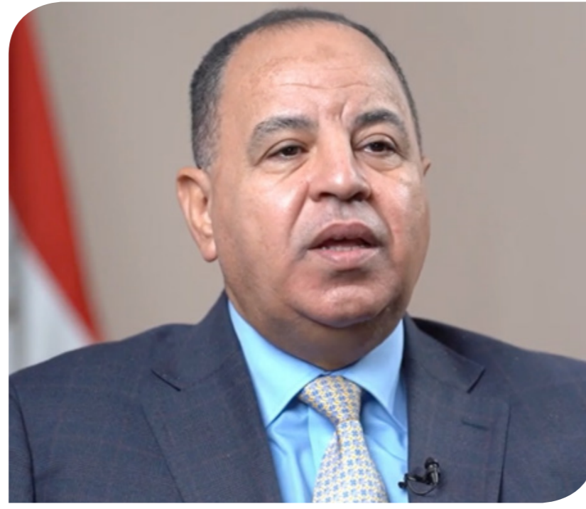
الدكتور محمد معيط وزير المالية

المناخية بالبلدان النامية. وقال إننا لا نستهدف أن يكون التحالف منبراً لجهود إعادة هيكلة الديون بل لتسليط الضوء على الوضع المالي الصعب للاقتصادات الناشئة والبلدان النامية وآثاره على العمل المناخي والتنمية، بحيث يتم إطلاق مسار جديد للمشاورات عند تقاطع الديون والمناخ والتنمية معاً؛ إذ يجمع هذا «التحالف» بين الدول الدائنة والمدينة ويخدم مصالح الجميع. وأضاف وزير المالية، أن «مبادلة الديون» تسهم في توفير سيولة إضافية لمشروعات التكيف مع التغيرات المناخية وتحتاج إلى دعم مؤسسات التمويل الدولية وبنوك التنمية متعددة الأطراف من خلال نشر «التمويل المختلط»، وندعو وكالات التصنيف الائتماني ألا تعتبر «مبادلات الديون» وسيلة