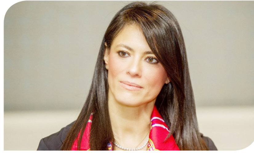
الدكتورة رانيا المشاط وزيرة التعاون الدولي

10 مؤسسات وطنية وإقليمية ودولية، هي: صندوق أبو ظبي للتنمية، والمصرف العربي للتنمية الاقتصادية في إفريقيا، والصندوق العربي للإنماء الاقتصادي والاجتماعي، وبرنامج الخليج العربي للتنمية، وصندوق النقد العربي، والبنك الإسلامي للتنمية، والصندوق الكويتي للتنمية الاقتصادية العربية، وصندوق الأوبك للتنمية الدولية، وصندوق قطر للتنمية، والصندوق السعودي للتنمية. وقالت وزيرة التعاون الدولي،