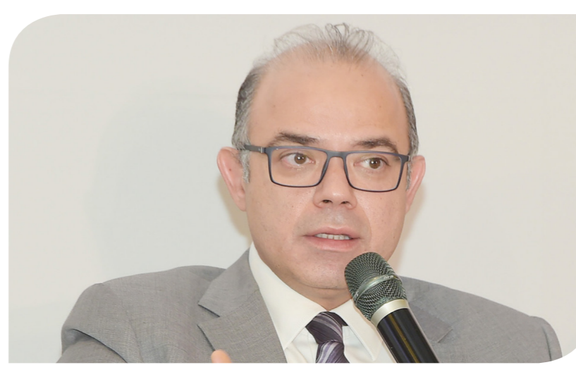
الدكتور محمد فريد رئيس هيئة الرقابة المالية

وتلتزم جهات التمويل التي لديها محفظة قائمة تحتوي على عملاء حاصلين على تمويل تكميلي بتخفيض محفظتها بما سدد من التمويل القائم في هذا السياق وفق توقيتات السداد الخاصة بالعملاء، ومواظبة الهيئة ببيان شهري بأرصدة تلك المحافظ وفق النموذج الذي تعده الهيئة لهذا الغرض.