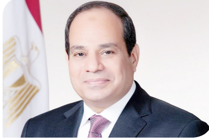
الرئيس عبد الفتاح السيسي

كما استعرض الاجتماع جهود الصندوق في استغلال المباني والأصول الحكومية التي سيتم إخلاؤها تمهيداً للانتقال إلى العاصمة الإدارية الجديدة، والتي تتمثل أهم عناصر الجذب الاستثماري بها في أنشطة ريادة الأعمال والأنشطة الإدارية والفندقية والتعليمية. وتناول أيضا الشراكات التي أبرمها "صندوق مصر السيادي" مع عدد من الصناديق السيادية العربية والعالمية ودورها في توفير فرص استثمار مشتركة، فضلاً عن عرض خطة عمل الصندوق الفرعي للطبوحات وآلية تنفيذ وثيقة ملكية الدولة بهدف إتاحة فرص استثمارية متنوعة وجاذبة. وقال المتحدث الرسمي باسم رئاسة الجمهورية إن الرئيس اطلع أيضاً على ملامح البرنامج الترويجي الذي يعتم