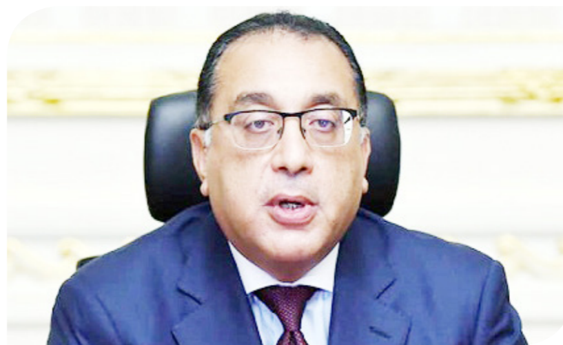
الدكتور مصطفى مدبولي رئيس مجلس الوزراء

الاستثمار الجهود الخاصة بملف إصدار الرخصة الذهبية، مؤكداً أن هذا الملف يحظى باهتمام كبير في الوقت الراهن. وأشار هيئة إلى إنشاء وحدة بالهيئة تختص بـ "الرخصة الذهبية"، وأن هناك متابعة مستمرة ودقيقة لخطوات إصدار الرخصة مع كل من تقدم للحصول عليها يدويًا أو إلكترونياً. وأكد التنسيق مع رئيس هيئة التنمية الصناعية بهدف الترويج للصناعات التي يتم العمل على توطيدها في مصر، لافتاً إلى إعداد دراسات في هذا الشأن. وأضاف أن هيئة الاستثمار تبذل جهوداً من أجل اتخاذ الإجراءات اللازمة وتقديم تيسيرات واسعة للراغبين في تنفيذ المشروعات