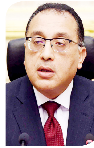
الدكتور مصطفى مدبولي رئيس مجلس الوزراء

أنه من المخطط أن يكون أحد أكبر المدن الصناعية في مصر على مساحة 5 ملايين متر مربع، حيث ستتوسع استخدامات الأراضي بين الأنشطة الصناعية، واللوجستية والتجارية والإدارية والخدمية، بالقرب من ميناء 6 أكتوبر الجاف. وأشار إلى أن المدينة الجديدة سيتم ربطها مباشرة بميناء الإسكندرية عبر السكك الحديدية، وستتضمن أيضاً أكاديمية السويدي للتدريب، ومنطقة إدارية وخدمات، والمنطقة التجارية، والمنطقة