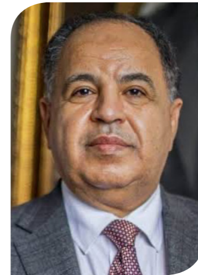
الدكتور محمد معيط وزير المالية