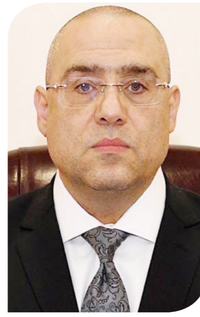
الدكتور عاصم الجزار وزير الإسكان

الصناعية، ومنطقة المخازن، وسترال بارك، ومنطقة لوجيستية. ولفت إلى أن المشروع سينفذ على 3 مراحل، ومن المتوقع أن يضيف سنويا بعد إتمامه حوالي 5 مليارات جنيه إلى الناتج القومي المحلي بالإضافة إلى جذب استثمارات أجنبية ومحلية تبلغ قيمتها 20 مليار جنيه، فضلا عن توفير أكثر من 150000 فرصة عمل في مختلف الصناعات، وبناء وتنمية أكثر من 400 مصنع وحوالي 100 منشأة لوجيستية وتجارية.