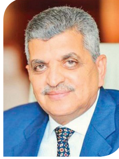
الغريق أسامة ربيع رئيس هيئة قناة السويس