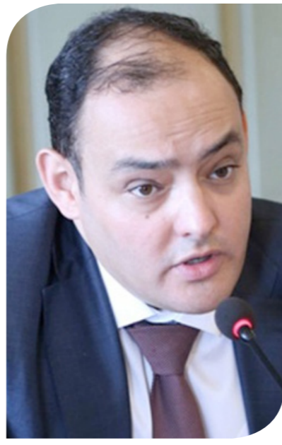
المهندس أحمد سمير وزير الصناعة والتجارة

وقال السويدي: "هدفنا الرئيسي هو التنمية، ونعمل بسرعة للغاية على توصيل المرافق، وسنراعي ما تم ذكره، وسنضع الضوابط المطلوبة". ومن ناحيته، قال محمد القماح، الرئيس التنفيذي لمجموعة السويدي للتنمية الصناعية، المطور الصناعي التابع لمجموعة السويدي للإلكترونيك، إن المدينة ستشهد إقامة محطات كهرباء بقدرة 1500 ميغا وات، مشيراً