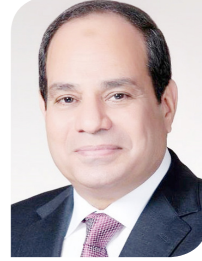
الرئيس عبد الفتاح السيسي