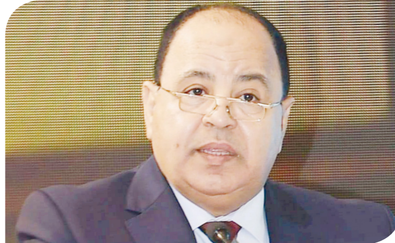
الدكتور محمد معيط وزير المالية

على 3 أبعاد رئيسية: بيئية واجتماعية واقتصادية، وتحدد مسار السياسات والبرامج اللازمة لإنجاز الأهداف الأممية؛ بما يساهم في إرساء دعائم التنمية الشاملة على نحو مستدام. جاء ذلك خلال احتفال تكريم مجموعة العمل الوزارية المشتركة التي تضم ممثلي 12 وزارة؛ تقديراً لجهودها في إطلاق «إطار التمويل المستدام». ونوه بأن فريق عمل إطار «التمويل السيادي المستدام»، عكف على استيفاء البيانات الفنية اللازمة لإضافة فئات جديدة للمشروعات الخضراء وذات البعد الاجتماعي