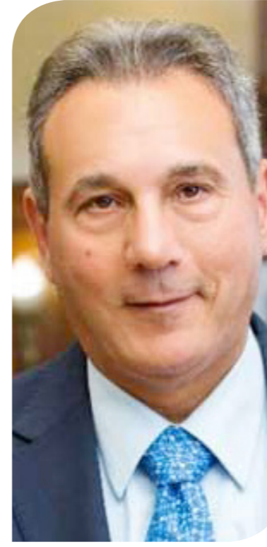
محمد الأترابي رئيس مجلس إدارة بنك مصر