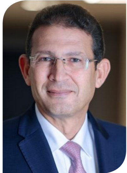
محمد بدير الرئيس التنفيذي لبنك QNB الأهلي مصر

فتح الحساب ورسوم إصدار بطاقات الخصم والائتمان مع تقديم معدلات أعلى على حساب التوفير، ومعدلات عائد تنافسية على الودائع والقروض وإتمام المدفوعات وتحويل الأموال بدون عمولات وبمصرفات مخفضة. كشفت محمد بدير عن بلوغ حجم المدفوعات الرقمية التي تمت عبر القنوات الإلكترونية لدى البنك 177 مليار جنيه، خلال عامي 2021 و2022.