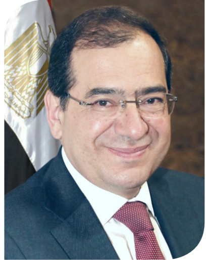
طارق الملا وزير البترول والثروة المعدنية

تحقيق فائض في الميزان التجاري البترولي للعام الثالث على التوالي يصل إلى أكثر من 3 مليارات دولار في 2022. وشدد على أن قطاع البترول يسير نحو تحقيق أهدافه الاستراتيجية بما يخدم البعد الاقتصادي للتنمية المستدامة لمصر.