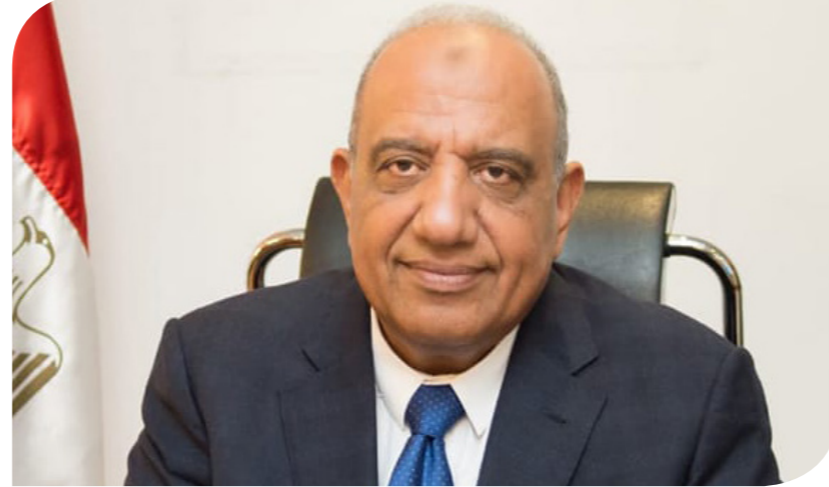
المهندس محمود عصمت وزير قطاع الأعمال العام

والتجارية من خلال التسويات الودية لتحقيق مزيد من الجذب للاستثمارات المحلية والأجنبية، وخلق بيئة مواتية للاستثمار. أوضح وزير قطاع الأعمال أن الشركة القابضة للتشييد والتعمير ستحصل بموجب التسوية على تعويض نحو 231 مليون جنيه من الشركة المالكة لشركة النيل لحليج الأقطان. واعتمدت اللجنة الوزارية لتسوية منازعات عقود الاستثمار، التسوية الودية للنزاع