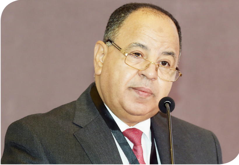
الدكتور محمد معيط وزير المالية

وقال وزير المالية إنه إذا كان العامل مستحقاً لمعاش عن نفسه ولم يبلغ