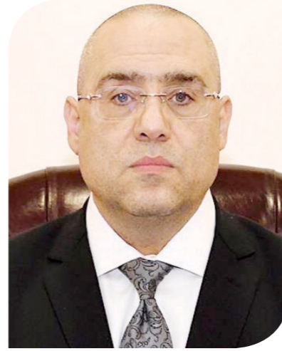
الدكتور عاصم الجزار وزير الإسكان والمرافق والمجمعات العمرانية

تدعم هدف تنشيط السياحة في هذا الموقع المهم.