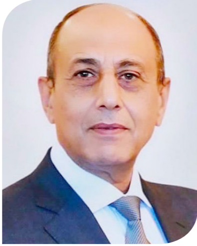
الفريق محمد عباس حلمي وزير الطيران المدني

ومن جانبه، أوضح الفريق محمد عباس حلمي وزير الطيران المدني، وزير السياحة، الموقف التنفيذي لأعمال تطوير مطار سانت كاترين الدولي، والمتضمن تطوير الحقل الجوي، والتي تشمل إنشاء ممر جديد بطول 3 آلاف متر، وتوسعة الترمك ليصبح 8 مواقف طائرات، وتطوير مبنى الركاب والمباني الخدمية، وكذا إنشاء مبنى ركاب جديد بسعة 600 راكب/ ساعة، مكون من طابقين.