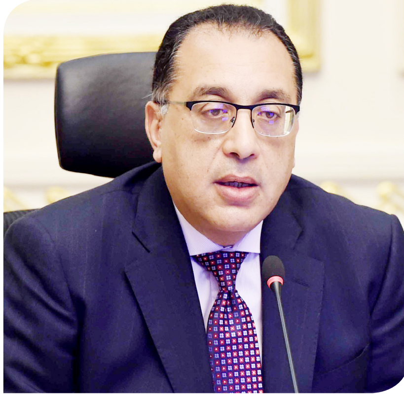
الدكتور مصطفى مدبولي رئيس الوزراء

وأكد مدبولي أن الحكومة تعمل على استكمال تنفيذ مجموعة من الإصلاحات الهيكلية لتحسين مناخ الأعمال وضمان تكافؤ الفرص بين الجميع، موضحاً أن وثيقة سياسة ملكية الدولة، التي انتهت منها الحكومة مطلع العام الجاري، تسمح بمشاركة أكبر للقطاع الخاص في الاقتصاد، وزيادة مساهمته من 30% إلى 65% على