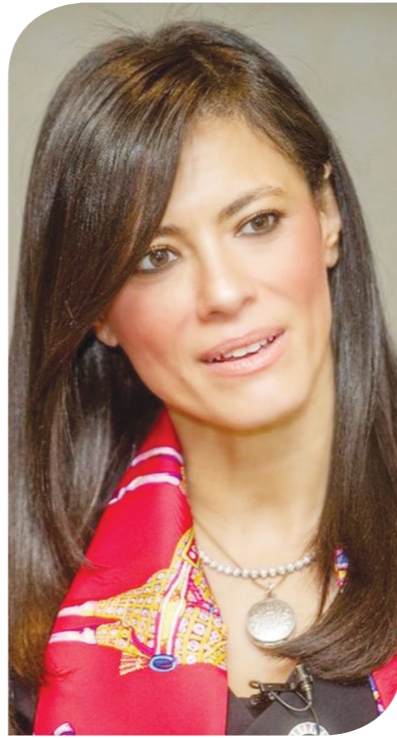
الدكتورة رانيا المشاط وزيرة التعاون الدولي

وبلغت محفظة ضمانات الوكالة الدولية لضمان الاستثمار (ميغا) للقطاع الخاص نحو 480 مليون دولار ومن بينها ما جرى مؤخراً من ضمانات لدعم استثمارات