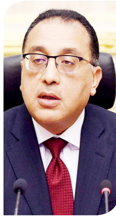
الدكتور مصطفى مدبولي رئيس الوزراء

واستعرضت وزيرة التعاون الدولي محفظة التعاون الإنمائي الجارية مع مجموعة البنك الدولي، والتي تضم 15 مشروعاً في مختلف