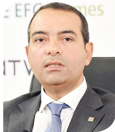
أيمن سليمان الرئيس التنفيذي لصندوق مصر السيادي