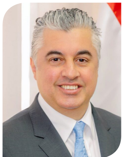
وليد جمال الدين رئيس الهيئة العامة للمنطقة الاقتصادية لقناة السويس

لمجال المنسوجات والغزل الكتانية، مستهدفة التصدير لأوروبا بنسبة 100%. باستثمارات متوقعة تصل إلى أكثر من 60 مليون دولار، لإنتاج مجمع مصانع متلامسة لإنتاج المنسوجات والغزل الكتانية، وتوفير فرص عمل متوقعة تفوق 1200 فرصة عمل.