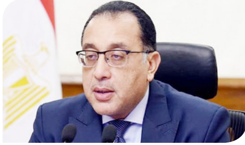
الدكتور مصطفى مدبولي رئيس الوزراء

ونوه الاجتماع بتلقي العروض خلال شهر مايو الجاري: تمهيدا للترسية وفقا للجدول الزمنية المحددة، مؤكدا وجود تحالفات كبرى بين شركات مصرية وأجنبية أبدت رغبتها واهتمامها في التقدم. وقال المتحدث الرسمي باسم مجلس الوزراء إن الاجتماع تطرق أيضا إلى موقف طرح محطة توليد الطاقة من