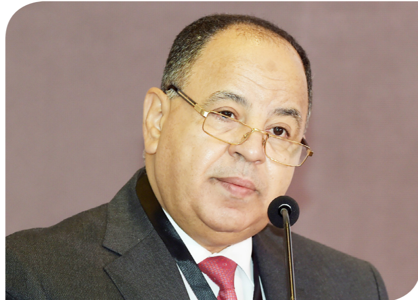
الدكتور محمد معيط وزير المالية

وأشار معيط إلى استطلاع أسواق دين جديدة حالياً، ونبهت إمكانية دخول أسواق الدين اليابانية مرة أخرى بعد طرح 500 مليون دولار سابقاً.