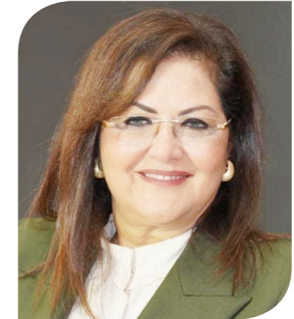
الدكتورة هالة السعيد، وزيرة التخطيط والتنمية الاقتصادية