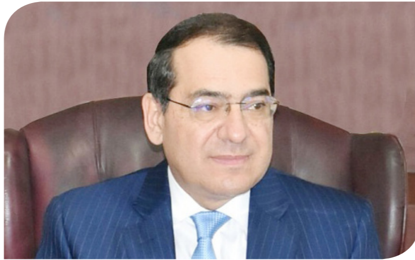
المهندس طارق الملا وزير البترول والثروة المعدنية

مجالات تمويل السفن وحلول الاقتصاد منخفض الكربون وغيرها. وأشار الوزير، خلال لقائه ممثلي الشركة، إلى أن قطاع البترول لديه فرص كبرى لمزيد من التعاون واجتذاب استثمارات وشركات عالمية تضاف لشركاته المتميزة القائمة وأن هذه الفرص متاحة للمشاركة الجادة، والتي تضيف تنوعا في الاستثمار والتقنيات والخبرات التي تضاف لصناعة البترول والاقتصاد المصري. وأكد وفد الشركة الفائزة بالرخصة التعاون مع فريق عمل اللجنة، مشيرين إلى أنه "ذلل الكثير من التحديات، ويعمل على الإسراع بمنح الرخص"، كما لفت إلى إدراك الشركة أهمية مصر، وأهمية تقديم خدمات تمويل