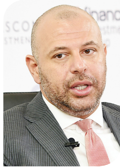
رامي الدكاني رئيس البورصة المصرية

واحدة راجع إلى درجة النقاء التي تعتمد عليه، وعلى أساسها ستجري عمليات الشراء في وثائق صندوق الاستثمار في الذهب. وأضاف الدكاني أن البورصة المصرية تعمل على تطوير برنامج تداول خاص يتيح تلقي طلبات شراء واسترداد وثائق صندوق الاستثمار في