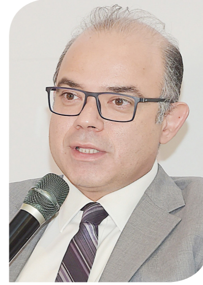
الدكتور محمد فريد رئيس الهيئة العامة للرقابة المالية