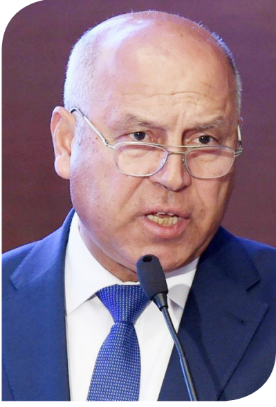
الفريق مهندس كامل الوزير وزير النقل