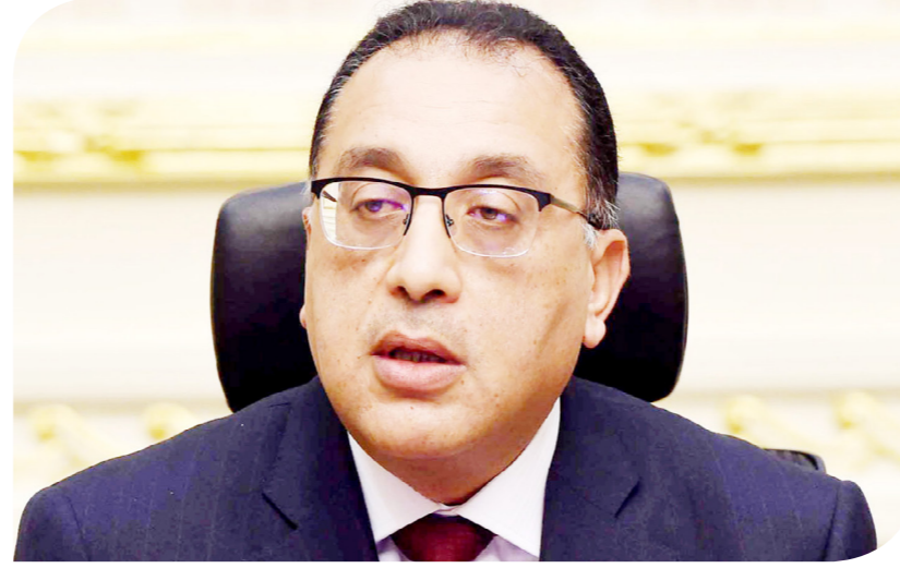
الدكتور مصطفى مدبولي رئيس الوزراء

السوق المحلية. وأشار إلى أن الاجتماع يأتي في إطار المتابعة المستمرة لما يتم تنفيذه من إجراءات وطروحات لحصص عدد من الشركات ضمن برنامج الطروحات الحكومية والذي يأتي في إطار تنفيذ وثيقة سياسة ملكية الدولة، التي تهدف إلى تعزيز دور القطاع الخاص في النشاط الاقتصادي، وخلق البيئة الاقتصادية الداعمة والجادبة للاستثمارات