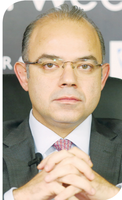
الدكتور محمد فريد رئيس هيئة الرقابة المالية

المالية لتمكين من نمو وتطوير أعمالها. وشدد على أهمية عمل شركات التمويل الدراسات الائتمانية اللازمة، وإجراء الزيارات الميدانية للتأكد من وجود أنشطة اقتصادية لدى مقدمي طلبات التمويل بالإضافة إلى ضرورة تطوير قواعد البيانات لتعزيز قدرة الأفراد والشركات للحصول على التمويل. وأشارت الهيئة، في بيان، إلى أن قيمة أرصدة تمويل المشروعات المتوسطة والصغيرة ومتناهية الصغر بلغت 42 مليار ومعد ذلك، يشير صالح إلى أن انخفاض قيمة الجنيه سيُسبب في انكماش السوق نتيجة تآكل القدرة الشرائية للمستهلكين، موضحاً أن المجموعة تتعامل مع هذه التحديات بشكل لحظي، يوماً بعد يوم، في ظل رؤية لما يمكن أن يحدث لاحقاً.