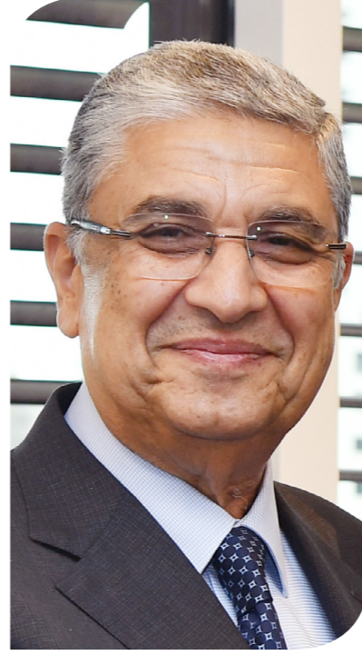
وزير الكهرباء والطاقة المتجددة، الدكتور محمد شاكر

حصول شركة "سكاك" على موافقة مشغل الشبكة الإيطالي، وتعيين استشاري دولي متخصص في مشروعات الربط الكهربائي المثيلة للمشروع محل مذكرة التفاهم، على أن يكون جزءاً من نطاق عمل الاستشاري تحديد مصادر الطاقات المتجددة التي ستستخدم لتصدير الطاقة، بالإضافة إلى عناصر البنية الأساسية كافة اللازمة لذلك، وكذا تحديد مسار الكابل البحري اللازم للمشروع والأسلوب الأفضل لتنفيذه، وذلك في إطار من الالتزام بمعايير الأداء المتعلقة بالاستدامة البيئية والاجتماعية. وأضاف: "عقب الانتهاء من دراسات المشروع، واعتماد الشركة المصرية لنقل الكهرباء لها، ستبدأ مناقشة والاتفاق على خطوات تنفيذ المشروع بهدف تصدير الطاقة المتجددة إلى أوروبا عبر إيطاليا بالتنسيق مع مشغل شبكة النقل الإيطالية". وقال تيريه بيلسكوج، الرئيس التنفيذي لشركة سكاك، إنها في ضوء نتائج دراسات المشروع، واعتماد مشغلي الشبكات في مصر وإيطاليا لنتائج الدراسة، ستقود لاحقاً أنشطة تطوير المشروع وستكون مسؤولة بشكل أساسي عن الحصول على تمويل المشروع بأسعار تنافسية من مؤسسات تمويل دولية مع فترة سداد طويلة الأجل، على أن يتم ذلك