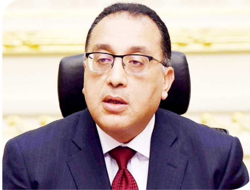
الدكتور مصطفى مدبولي رئيس الوزراء

قال رئيس الوزراء، الدكتور مصطفى مدبولي، إن أي مقترحات تستهدف خلق مناخ جاذب للاستثمار ستكون محل دراسة، مؤكداً: "نحن منفتحون على كل الأفكار والآراء". جاء ذلك خلال اجتماع المجلس الاستشاري الاقتصادي، أمس، برئاسة مدبولي؛ لاستعراض قرارات المجلس الأعلى للاستثمار الأسبوع الماضي، وخطة تنفيذها بما يحفز مناخ الاستثمار والأعمال في مصر. وقال رئيس الوزراء إن الحكومة ستتابع بشكل دوري تنفيذ هذه القرارات، لافتاً إلى أن هناك تكاليف واضحة ومحددة لكل وزير وفقاً لبرنامج زمني، مستعرضاً مستهدفات هذه القرارات.