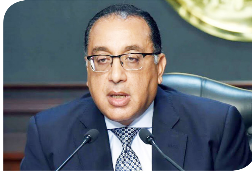
الدكتور مصطفى مديبولي رئيس الوزراء

الأولويات المطلوبة، فيما يجري التنسيق بهذا الشأن لدفع هذه الصناعة المهمة. وعرض رئيس غرفة صناعة الدواء باتحاد الصناعات، الدكتور جمال الليثي، الاحتياجات اللازمة للقطاع الطبي من خامات ومستلزمات دوائية وخلافه، لعدة أشهر قادمة، بما يسهم في توفير الدواء الآمن الفعال للمواطنين، والحفاظ على اقتصاديات الشركات العاملة في هذا القطاع المهم. وأشار وكيل أول محافظ البنك المركزي، محمد أبو موسى، إلى أن توفير الخامات والمستلزمات الطبية يأتي على رأس أجندة الأولويات الاستراتيجية، مستعرضاً تفاصيل ما أتيج من تمويل دولاري