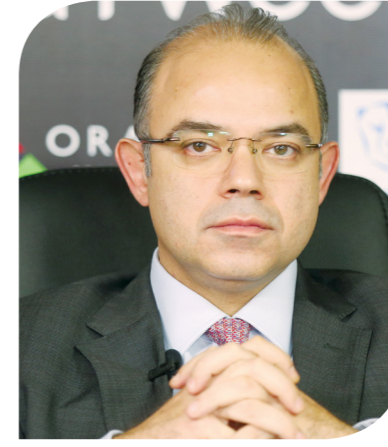
الدكتور محمد فريد رئيس الهيئة العامة للرقابة المالية

لمعالجة نقص تمويل مشروعات التكيف المناخي، وتعزيز الشراكة بين القطاعين العام والخاص، ركزت الهيئة على الوصول ونقل المعرفة الكاملة بأدوات تمويل الاقتصاد الأخضر كالسندات الخضراء والزرقاء والفرق بينهما على سبيل المثال حتى تساعد الشركات على اختيار الأداة التمويلية الأنسب. كما أكد أن كل الجهود التي بذلت على مدار الأعوام الماضية والاستثمارات التي تم تنفيذها تحتاج إلى وقت ليجني ثمارها. وتابع: "حشد التمويل لمشروعات التكيف المناخي يحتاج إلى أدوات متنوعة حتى تكون الاستثمارات ذات جدوى، وأيضا حتى تتمكن البلدان من استقطاب التمويل اللازم".