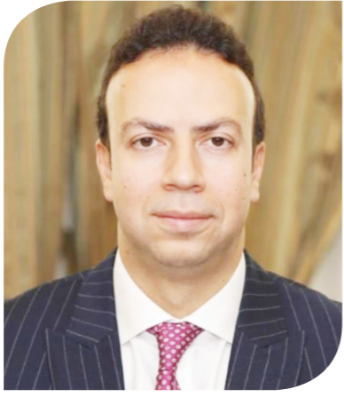
رامي أبو النجا نائب محافظ البنك المركزي المصري

مساهم رئيسي في تقليل تكاليف المشروعات وكذلك تخفيف المخاطر المرتبطة به. ولقت نائب محافظ البنك المركزي المصري إلى أن الوصول إلى التمويل الميسر يؤثر أيضاً بشكل واضح على التسعير الخاص بالخدمات التي يتم إنتاجها في المشروعات المختلفة بمجالات البنية الأساسية والتحتية. وأكد أبو النجا ضرورة تعزيز دور المؤسسات التمويلية متعددة الأطراف في حشد التمويل المختلط لمشروعات التحول الأخضر داخل القارة.