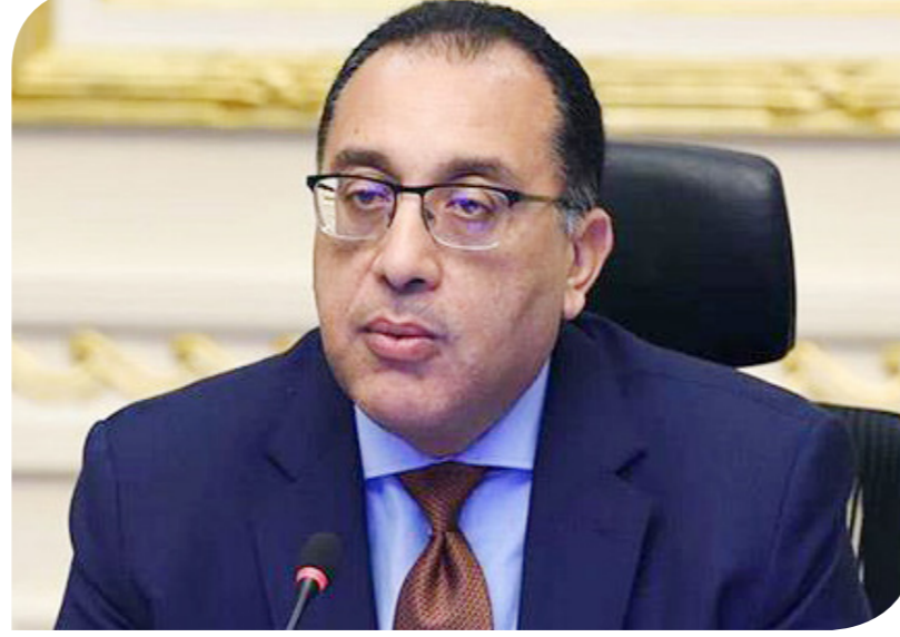
الدكتور مصطفى مديبولي رئيس الوزراء

بنظام المناطق الحرة الخاصة من عدمه. وتضمنت الشروط أيضاً ضرورة وضع كل مشروعات المناطق الحرة جميع السجلات والدفاتر تحت تصرف الهيئة في أثناء عمليات الفحص والمتابعة، وللهيئة أن تستعين بمن تراه من الجهات المعنية في هذا الشأن. وتسقط الموافقة النهائية على المشروع إذا لم يتخذ المستثمر إجراءات جديّة تنفيذية، ومن ذلك البدء في إجراءات التأسيس، وتقديم الرسومات الهندسية، والحصول على الموافقات اللازمة لإقامة المشروع من الجهات المعنية، فضلاً عن الجدول الزمني للبدء في مزاولة النشاط، وذلك خلال ستة أشهر من تاريخ إخطاره بقرار الموافقة على