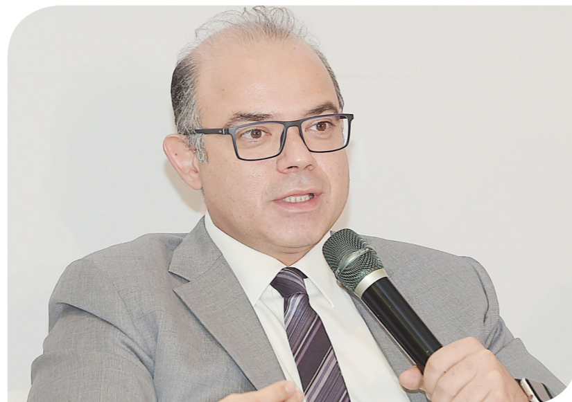
الدكتور محمد فريد، رئيس مجلس إدارة هيئة الرقابة المالية

وتضمن القرار رقم 105 لسنة 2023 منح الشركات التي تأسست أو تقدمت بطلبات تأسيس أو حصلت على موافقة مبدئية على التأسيس لمزاولة نشاط التأجير التمويلي أو التخصيم أو تمويل المشروعات