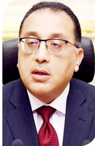
الدكتور مصطفى مدبولي رئيس الوزراء

يتمتع بمخاطر منخفضة وتفاعل إيجابي مع مؤسسات التمويل وشركاء التنمية. وأضاف أن مجال الطاقة الجديدة والمتجددة من شأنه أن يسهم في تقليل الاعتماد على الوقود الأحفوري، مع مواصلة خفض الانبعاثات الكربونية، مما يتماشى ويتواءم مع استراتيجية مصر للطاقة للوصول إلى نسبة مشاركة