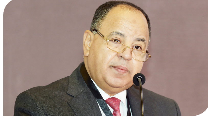
الدكتور محمد معيط وزير المالية