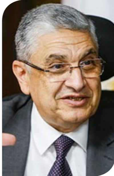
الدكتور محمد شاكر وزير الكهرباء والطاقة المتجددة

ومن جانبه، قال الدكتور سلطان بن أحمد الجابر، وزير الصناعة والتكنولوجيا المتقدمة، الرئيس المعين لمؤتمر COP28 ورئيس مجلس إدارة "مصدر"، إن هذا النوع من المشاريع له دور مهم في دعم العمل المناخي والوصول إلى هدف تفاذي تجاوز الارتفاع في درجة حرارة الكوكب عتبة 1.5 درجة مئوية، كما يسهم في تعزيز التنمية الاقتصادية والاجتماعية.