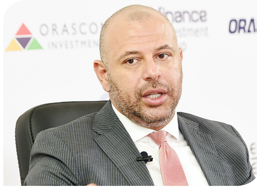
رامي الدكاني رئيس البورصة المصرية

النتيجة عن تعاملات هذا اليوم دون مسائلة. وأكدت المصادر أن ما شهدته البورصة المصرية أمس حادث عارض تعرضت له من قبل عدد كبير من البورصات المتقدمة، مستهدفة بتعطيل بورصة نيويورك عام 2015 لنحو ثلاث ساعات، وتعطل بورصة لندن عام 2017 لمدة ساعتين تقريبا، كما تكررت الاعطال الفنية في بورصات طوكيو وهونغ كونغ خلال عامي 2018 و2019 على التوالي. وقال رامي الدكاني رئيس البورصة المصرية في تصريحات تلفزيونية أمس أنه تم رفض طلبات عديدة لإلغاء تعاملات أمس تطبيقا لمبدأ الشفافية. وتابع الدكاني: "أنهينا إغلاقات الجلسة وتمت التسوية وأرسلت