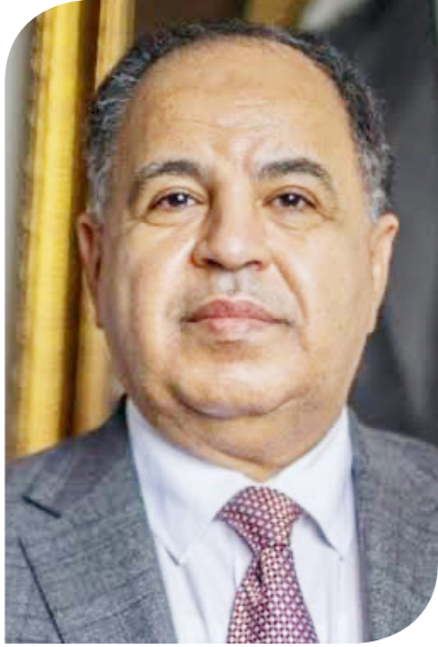
الدكتور محمد معيط وزير المالية

العام الجديد "طموحة وأكثر تحفيزاً للنمو والإنتاج والتعافي الاقتصادي"، مشيراً إلى أن قيمة المصروفات العامة فيها تبلغ نحو 3 تريليونات جنيه، والإيرادات 2.1 تريليون جنيه.