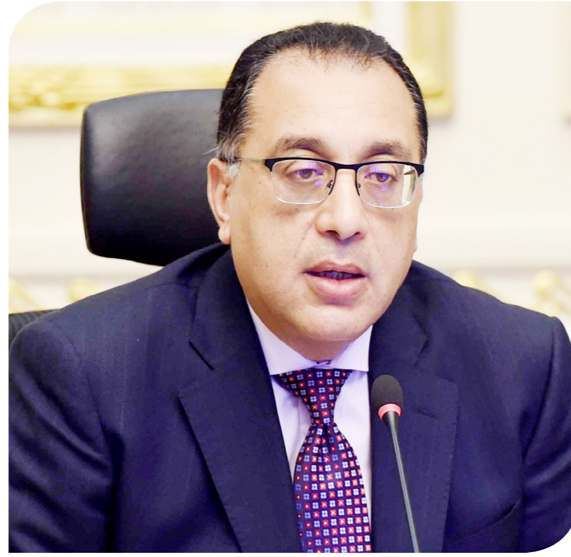
الدكتور مصطفى مدبولي رئيس الوزراء

هلال، رئيس الاتحاد، بالشكر على الترشيح لعضوية المجلس الأعلى للاستثمار، برئاسة السيد الرئيس، مؤكداً أن الاتحاد يدرك تماماً الأهمية غير المسبوقة من القيادة السياسية والحكومة بالاستثمار والمستثمرين. وقال هلال إن القرارات الأخيرة التي اتخذها المجلس الأعلى للاستثمار لاقت ارتياحاً كبيراً بين أوساط المستثمرين. وطالب أعضاء مجلس إدارة اتحاد المستثمرين، خلال الاجتماع، باستمرار القوانين واللوائح التي أنشئت بمقتضاها الشركات طوال مدة عملها، باعتبار أنها قد بنيت عليها دراسات، مطالبين أيضاً بتيسير الإجراءات وحوكمتها في تخصيص الأراضي الصناعية. وصرح السفير نادر سعد، المتحدث الرسمي باسم مجلس الوزراء، بأن أعضاء مجلس إدارة الاتحاد أكدوا، خلال الاجتماع، أهمية مشروع المثلث الذهبي،