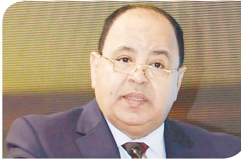
الدكتور محمد معيط وزير المالية

السنوات الماضية تزايدت بقوة. وأوضح وزير المالية أن فاتورة الاستيراد قبل يناير 2022 كانت في حدود 6.5 مليار دولار