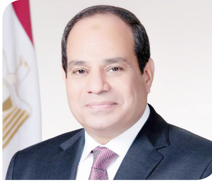
الرئيس عبد الفتاح السيسي

"رجعت ثاني" بسبب زيادة سعر الصرف، قال الرئيس السيسي إن مصر كانت تتجه في السنوات الأخيرة إلى الأسواق الدولية لشراء 3-4 مليارات دولار حتى تحافظ على رصيد احتياطي نقد أجنبي عند 34 مليار دولار لدى البنك المركزي لتغطية واردات 3 - 4 شهور. وأضاف: "كنا بننزل نجيب من الأسواق ونزود حجم الدين علينا.. ما نقدرش نعمل كدة ثاني".