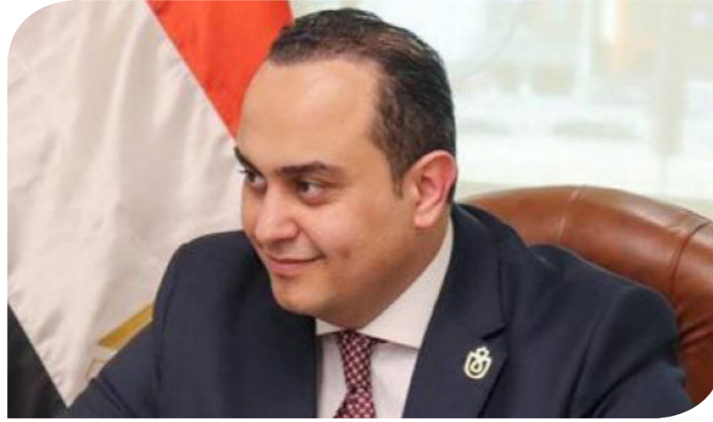
الدكتور أحمد السبكي رئيس الهيئة العامة للرعاية الصحية المشرف العام على مشروع التأمين الصحي الشامل

50 مستشفى وأكثر من 300 مركز ووحدة طب أسرة بالست محافظات. جاء ذلك في بيان صحفي، أمس؛ بمناسبة مرور 4 سنوات على إطلاق الرئيس عبد الفتاح السيسي، إشارة بدء التشغيل التجريبي لمنظومة التأمين الصحي الشامل من محافظة بورسعيد، في الأوتل من شهر يوليو عام 2019. وأوضح أن خطط التطوير والتحديث للمنشآت الصحية لانضمامها للعمل تحت مظلة