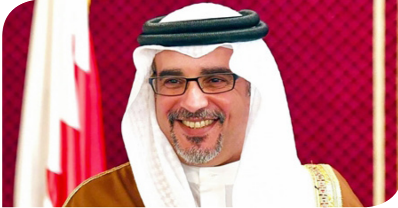
سلمان بن حمد آل خليفة ولي عهد البحرين

بنمو القطاع غير النفطي، إذ أدى استمرار زخم الإصلاحات المالية وارتفاع أسعار النفط إلى تحسين رصيد المالية العامة، بحسب التقرير الأخير لصندوق النقد الدولي. ووفقا لصندوق النقد الدولي في مراجعته الأخيرة، فقد نما اقتصاد البحرين بنسبة 4.9% العام الماضي. ومن المتوقع أن ينخفض النمو الاقتصادي إلى 2.7% خلال