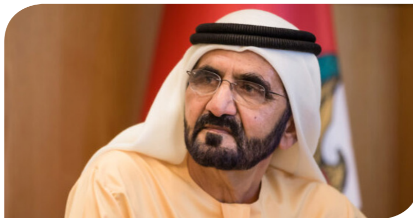
الشيخ محمد بن راشد آل مكتوم، رئيس الوزراء الإماراتي ونائب رئيس الدولة

حيث سيكون الهدف مضاعفة مساهمة الطاقة المتجددة 3 أضعاف خلال السبع سنوات القادمة، وضخ استثمارات وطنية بين 150 إلى 200 مليار درهم خلال نفس الفترة لضمان تلبية الطلب المتزايد على الطاقة في الدولة بسبب النمو الاقتصادي المتسارع. واعتمد مجلس الوزراء أيضاً الاستراتيجية الوطنية للهيدروجين - والذي برز