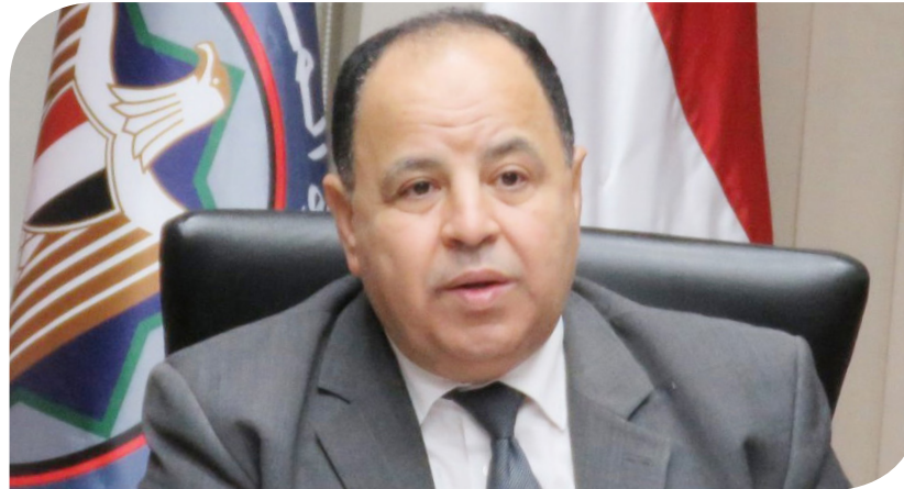
الدكتور محمد معيط وزير المالية

يساوي أو يزيد على مبلغ الضريبة خلال الشهر التالي لتحقيق الإيراد لأحد البنوك المسجلة لدى البنك المركزي المصري. وقال مصدر في تصريح خاص لجريدة حابي أن سبب إلغاء الفقرة الثانية هو ظهور حالات كشفت إساءة استخدامها. وكان الدكتور محمد معيط وزير المالية، قد قال في بيان صدر بتاريخ 27 نوفمبر الماضي، أن قرار تحصيل ضريبة القيمة