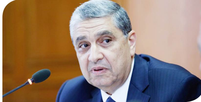
وزير الكهرباء والطاقة المتجددة، الدكتور محمد شاكر

المتجددة في مزيج الطاقة. وأكد مديولي أن الحكومة المصرية تولي أهمية كبيرة لمشروعات الطاقة المتجددة، وتعمل على زيادة مساهمتها في إجمالي مزيج الطاقة المولدة؛ ضمن خططنا للتخفيف من الاعتماد على الوقود الأحفوري، وهذا من شأنه توفير الكثير من العملة الصعبة للبلاد. وبدوره، استعرض المستشار أمجد سعيد، المستشار القانوني