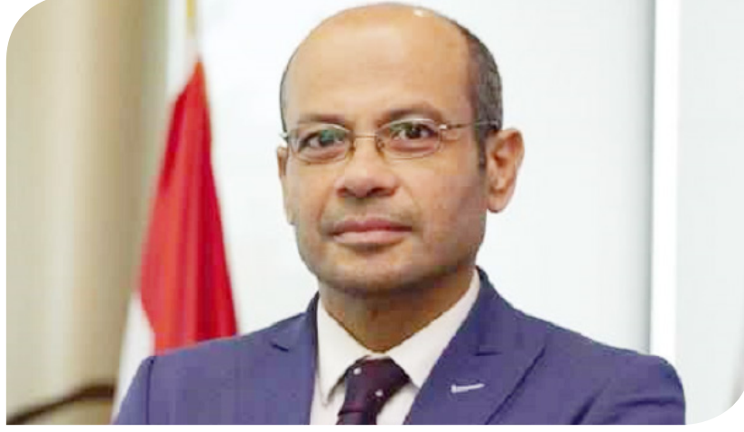
أحمد الشيخ رئيس البورصة المصرية

العمل لدى البورصة المصرية (أسوة بالمؤسسات المصرية) أو المتبقي من مدة صلاحية المستند الثبوتي أيهما أقل. وأضاف: أما فيما يتعلق بالمستندات الثبوتية لصناديق الاستثمار فسيتم الاكتفاء بـ"سويقت" يرسله أمين الحفظ العالمي إلى البورصة المصرية متضمنا جميع بيانات الصندوق المطلوب الإفصاح عنها. وقبل التعديل، يعتبر الحساب راكدا إذا لم يشهد تعاملًا عليه (بيعا أو شراء) لمدة 12 شهرا، في حين يتضمن المقترح زيادة هذه المدة