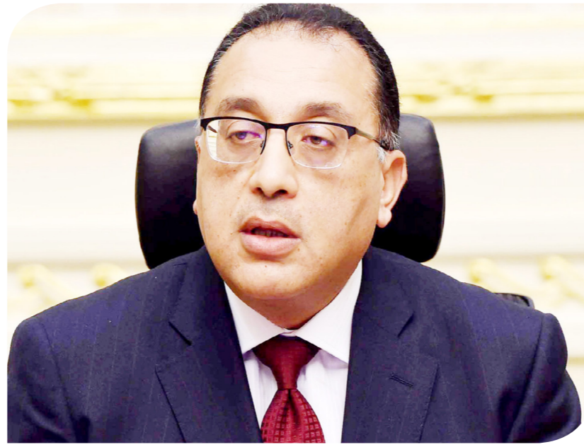
الدكتور مصطفى مدبولي رئيس الوزراء

وفتح رئيس الوزراء مجال النقاش حول مخرجات اللجنة التي عرضت، مشيراً إلى أن ما يهم في المقام الأول هو تنفيذ هذه المخرجات، بما يسهم في ضبط الأسواق، وعدم المضاربة. وكلف رئيس الوزراء بسرعة عقد اجتماعات مع مسئولي اتحاد الصناعات المصرية، والغرف التجارية، للتوافق