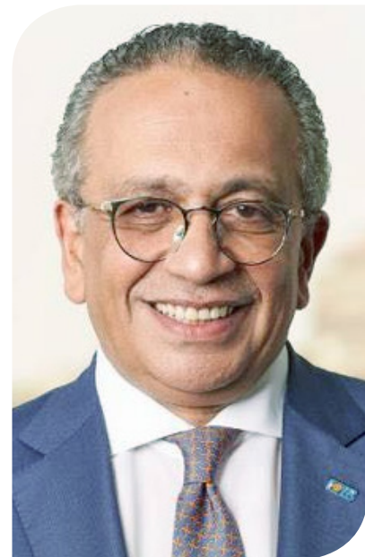
عمرو الجنائني نائب الرئيس التنفيذي والعضو المنتدب للبنك التجاري الدولي - مصر

الحفظ وملتقى الاكتاب. شارك في الاكتاب: بنكا البركة وABC. فيما تولى مكتب الدريني وشركاه للمحاماة والاستشارات القانونية دور المستشار القانوني للطرح بينما تولى مكتب حازم حسن للمحاسبة والمراجعة (KPMG) دور مراقب حسابات الإصدار. وجاء الإصدار على ثلاث شرائح، تبلغ قيمة الأولى 497.5 مليون جنيه ومدتها 13 شهراً، وتصنيفها الائتماني AA+ من شركة الشرق الأوسط للتصنيف الائتماني وخدمة المستثمرين (MERIS- IS)، وقيمة الشريحة الثانية 695.6 مليون جنيه ومدتها 36 شهراً، وتصنيفها الائتماني AA من شركة (MERIS)، فيما تبلغ