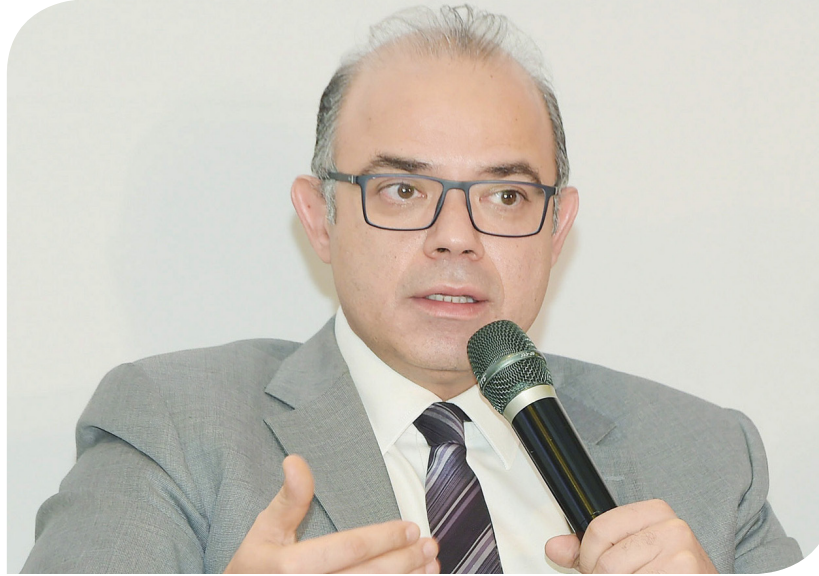
الدكتور محمد فريد رئيس هيئة الرقابة المالية

القواعد النظرية لها باللائحة التنفيذية لقانون سوق رأس المال. كما أصدرت الهيئة القرار رقم (224) لسنة 2023 بتعديل قرار مجلس إدارة الهيئة رقم (52) لسنة 2014 بشأن ضوابط وإجراءات طرح وثائق صناديق الاستثمار على دفعات والموافقة لشركة صندوق الاستثمار المغلق بطرح أكثر من إصدار للوثائق، لتيسير إجراءات تأسيس ونظام عمل صناديق الاستثمار وتذليل ما قد يعترضها من معوقات وتطوير آلياتها. وتضمنت التعديلات، إضافة مادة جديدة مستحدثة برقم الثانية مكرر، بهدف التيسير في متطلبات مزاولة نشاط صناديق الاستثمار بالسماح بإصدار أكثر من إصدار لوثائق الصندوق بدلا من السير في إجراءات تأسيس وترخيص شركة صندوق استثمار مستقلة لكل صندوق، على أن يكون لكل إصدار جماعة حملة وثائق مستقلة وحسابات مستقلة. كما تضمنت تيسير إجراءات إعداد ومراجعة ملف طرح الوثائق المقدم للهيئة؛ باعتماد نشرة إكتاب أو مذكرة معلومات تفصيلية للصندوق ككل وتقديم نشرة مختصرة تكميلية لكل إصدار. وتستهدف المادة الجديدة من القرار