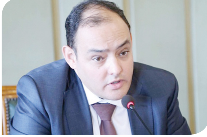
المهندس أحمد سمير وزير التجارة والصناعة

وفيما يتعلق بتنزانيا، أشار سمير إلى أن خطة الوزارة تتمثل في إقامة مركز تجاري مصري يقترح تنفيذه بمدينة دار السلام، مع أهمية أن تكون هناك مخازن تابعة له حتى يمكن توفير البضائع