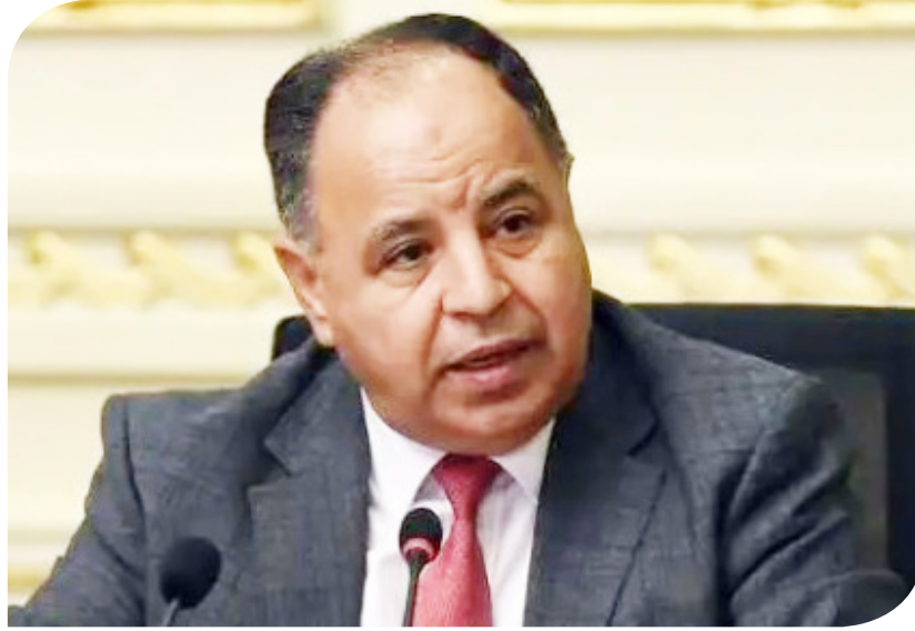
الدكتور محمد معيط وزير المالية

وأضاف وزير المالية أن هناك حوافز خاصة للأنشطة المرتبطة بتكنولوجيا المعلومات والاتصالات، لافتاً إلى ما تضمنه قانون تنمية المشروعات المتوسطة والصغيرة ومتناهية الصغر من حوافز ضريبية وغير ضريبية تشمل أنظمة ضريبية مبسطة في شكل مبلغ ضريبي مقطوع أو نسبة ثابتة صغيرة جداً من الإيراد حسب الأحوال دون الحاجة لإمسك دفاتر وسجلات وعدم الخضوع للفحص لمدة 5 سنوات على الأقل، وأشار إلى تعديل التعريفات الجمركية،