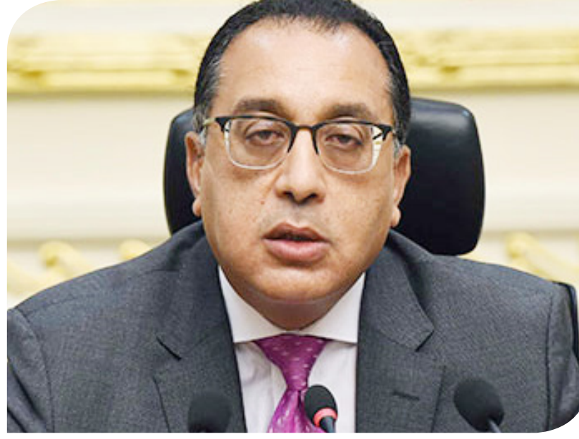
الدكتور مصطفى مدبولي رئيس الوزراء

توفير العملية الإنتاجية في مختلف مراحلها بالنسبة لإنتاج الخلايا الشمسية على ضوء توافر عناصر الإنتاج في مصر. وأضاف أن الشركة تمتلك التكنولوجيا اللازمة لتصنيع الخلايا الشمسية، وأنها قادرة على الوصول إلى نسبة تصنيع محلي تصل إلى 90% من المنتج النهائي. كما تطرق رئيس الشركة إلى جهودها وخبراتها في مجال تصنيع أشباه الموصلات، التي تمثل مدخلا مهما في صناعة السيارات الكهربائية، معربا عن تطلع الشركة للتعاون مع مصر في مجال صناعة السيارات الكهربائية من خلال أشباه الموصلات، وأن تصبح مصر مركزا مهما لعمليات الشركة، ونموذجا