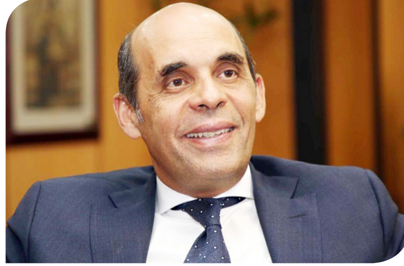
طارق فايد رئيس مجلس الإدارة والرئيس التنفيذي لبنك القاهرة

ونوه بأن حجم تمويل قطاع الشركات الصغيرة والمتوسطة بلغ 20.4 مليار جنيه بنهاية الربع الثالث من 2023 مقارنة مع 19.2 مليار جنيه بنهاية ديسمبر 2022. وفي مجال التجزئة المصرفية، قال فايد إن رصيدها بنهاية الربع الثالث من عام 2023 نحو 59.1 مليار جنيه مقارنة مع 47.1 مليار جنيه بنهاية عام 2022 بزيادة قدرها 12 مليار جنيه وبمعدل نمو 26%. وسجل رصيد تمويل المشروعات متناهية الصغر بنهاية الربع الثالث من