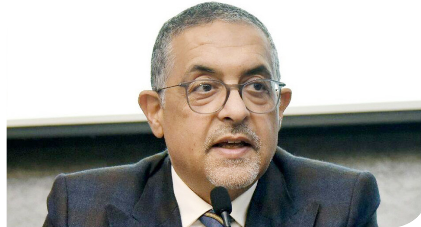
حسام هيئة الرئيس التنفيذي لهيئة الاستثمار والمناطق الحرة

الاقتصادية، الدكتورة هالة السعيد، قد صرحت، في نوفمبر الماضي، بأن مصر تجري مباحثات حاليا لتأسيس صندوق مصري عماني تضخ فيه أموال لمجالات محددة كالصناعات الزراعية والتصنيع الغذائي ومجال الأدوية. وأضاف هيئة، في تصريحات خاصة لنشرة حابي أمس، أن هيئة الاستثمار تستهدف جذب استثمارات أجنبية مباشرة بقيمة 12 مليار دولار خلال العام المالي الجاري.