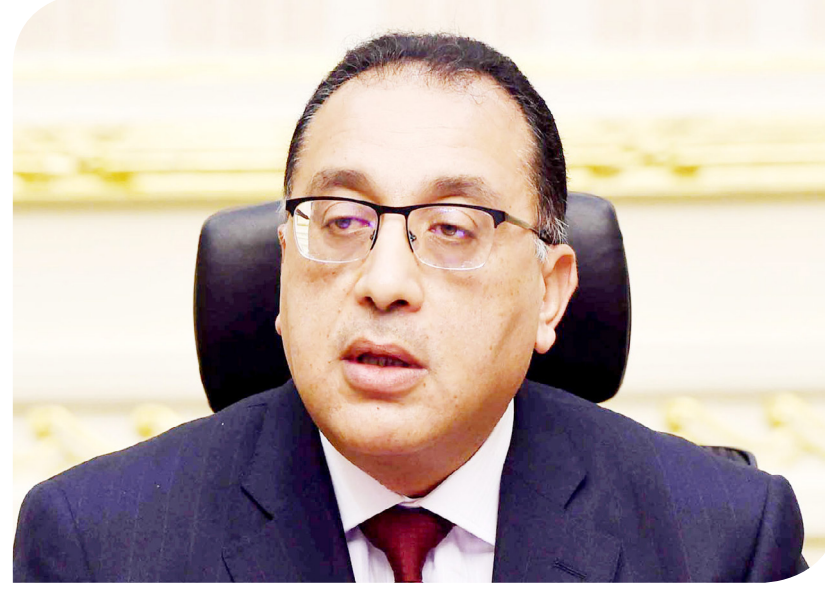
الدكتور مصطفى مدبولي رئيس الوزراء

التنمية الصناعية، الدكتورة ناهد يوسف، تقريرا بشأن الموقف التنفيذي لمنطقة شق الشعبان للرخام والجرانيت وجهود التطوير بها، لافتة إلى البدء في تطويرها لتحويلها لمدينة عالمية للرخام والجرانيت، باعتبار أن المنطقة أحد أهم تجمعات هذه الصناعة؛ من أجل تعظيم صادراتها. وأشارت رئيس الهيئة إلى أن منطقة شق الشعبان تضم 1372 مصنعا وورشنة، وتصل الطاقة الإنتاجية من الرخام والجرانيت للمنطقة إلى نحو 120 مليون م 2 ، بحجم استثمارات يبلغ 2.3 مليار دولار. ولفتت إلى أن نسبة مساهمة المنطقة في الصادرات المحجزة