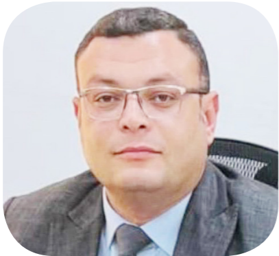
شريف الشربيني وزير الإسكان والمرافق والمجمعات العمرانية

سكن لكل المصريين، وكذلك مشروعات المبادرة الرئاسية "حياة كريمة" لتطوير الريف المصري، واستكمال مراحلها التالية.