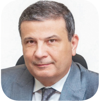
علاء فاروق وزير الزراعة واستصلاح الأراضي

والارشاد الزراعي وتنمية الثروة الحيوانية والسمكية والداجنة وصولاً لتحقيق استراتيجية مصر 2030.