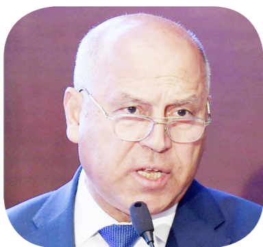
الفريق كامل الوزير نائب رئيس الوزراء للتنمية الصناعية ووزير النقل والصناعة

ترشيح الواردات وتشجيع الصادرات والاستفادة من الخامات المحلية