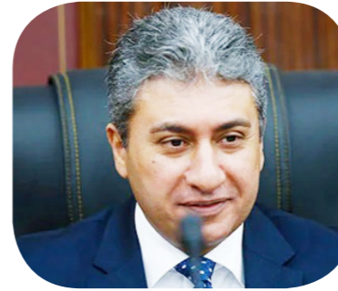
شريف فتحي وزير السياحة والآثار

العمل على الحفاظ على الآثار المصرية وافتتاح المتحف المصري الكبير والاستفادة من الإمكانيات السياحية والأثرية في مصر بصورة أكبر، واستكمال الخطوات التي اتخذتها الوزارة في ملف التحول الرقمي في قطاع السياحة والآثار.