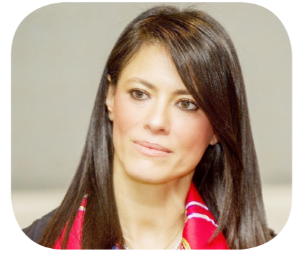
الدكتورة رانيا المشاط وزيرة التخطيط والتنمية الاقتصادية والتعاون الدولي

قالت وزيرة التخطيط والتنمية الاقتصادية والتعاون الدولي، الدكتورة رانيا المشاط، إن الفترة المقبلة ستشهد تحديد الأولويات الوطنية لجذب الاستثمار والقطاع الخاص، بما فيها تولى الصناعة والاستثمار في رأس المال البشري. كما أكدت، في أول تصريحات لها، استغلال الأدوات في ملفي التخطيط والتنمية الاقتصادية والتعاون الدولي، لتنفيذ التوجهات الرئاسية للحكومة بشأن مواصلة مسار الإصلاح الاقتصادي، والتركيز على ملفي الصحة والتعليم، وتطوير الصناعة. وترى المشاط أن دمج وزارتي التخطيط والتنمية الاقتصادية مع التعاون الدولي يجعل العمل أكثر كفاءة وفعالية ويعزز آلية مساندة الاقتصاد الكلي. وأشارت إلى أن العلاقات الدولية مع الشركاء الدوليين كلها مبنية على الاستراتيجيات والمشروعات الوطنية، ومع دمج الوزارتين سيكون هناك سلاسة بشكل أكبر لتكون الاستراتيجية