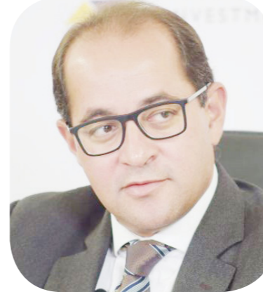
الدكتور أحمد كجوك وزير المالية

أخذًا في الاعتبار وضع سقف للدين لا يتجاوز 88.2% في السنة المالية الحالية. وقال كجوك، في أول تصريحات له، إنه تنفيذًا للتكليفات الرئاسية "سنبذل كل ما في وسعنا لتخفيف الأعباء المعيشية عن المواطنين خلال التنفيذ الفعلي للموازنة العامة للدولة في العام المالي الجديد"، مضيفًا: "نعمل على التوسع في الحماية الاجتماعية ببرامج أكثر استهدافًا للمستحقين للدعم في مواجهة التضخم".