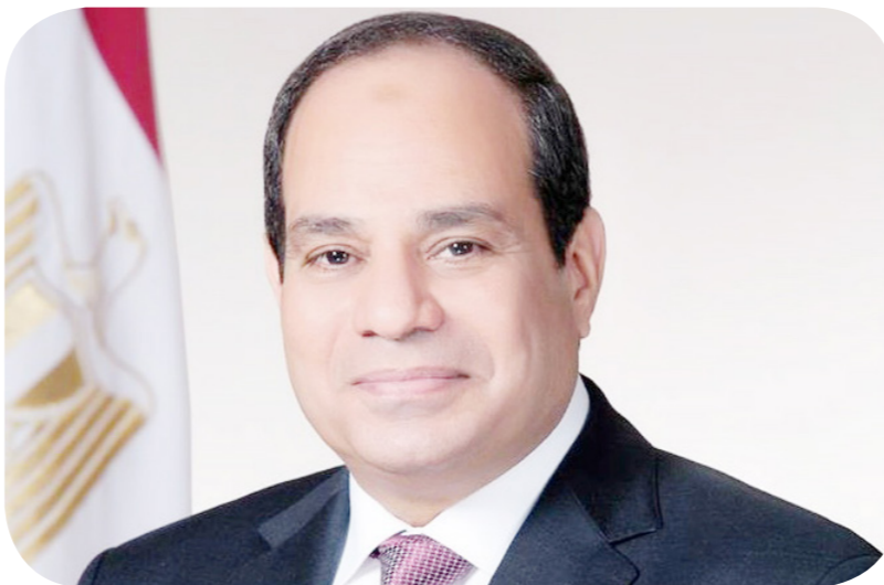
الرئيس عبد الفتاح السيسي