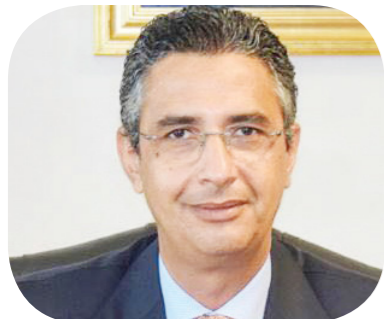
شريف فاروق وزير التمويل والتجارة الداخلية

للوجستية ومراكز الخدمة، وأسواق الجملة والنصف جملة، وفق بيان لوزارة التمويل. كما أشار إلى العمل على تطوير العنصر البشري والارتقاء بمهاراته لمواكبة المعطيات التكنولوجية التي يشهدها العالم بما يرتقي بمستوى الأداء والخدمات المقدمة للمواطنين.