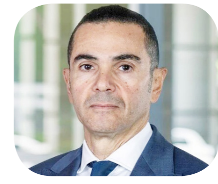
حسن الخطيب وزير الاستثمار والتجارة الخارجية

كشفت حسن الخطيب، وزير الاستثمار والتجارة الخارجية، أن أولويات المرحلة القادمة وفي ضوء المتغيرات المحلية والدولية هو زيادة الاستثمار الأجنبي والمحلي بشكل كبير، وذلك من خلال التركيز على تحسين بيئة الاستثمار وجعل البيئة الاستثمارية أكثر تنافسية. وأشار الوزير في تصريحات له عقب حلف يمين تولي الوزارة، أن الملف الثاني هو ملف التجارة الخارجية ومضاعفة الصادرات، وحل مشاكل المصدرين، وزيادة قاعدة المصدرين وفتح أسواق جديدة مع جذب شركات صناعية للتصدير من مصر. وأشار حسن الخطيب إلى أن المجموعة الوزارية ستبذل آليات تحسين البيئة الاستثمارية في مصر، ومواجهة التحديات بهدف جذب ومضاعفة أرقام