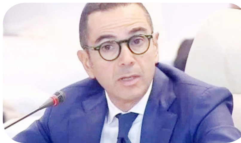
المهندس حسن الخطيب وزير الاستثمار والتجارة الخارجية

وضع رؤية متكاملة لقطاعي الاستثمار والتجارة الخارجية لتكون ركيزة ضمن الركائز الأساسية للسياسة الاقتصادية للدولة. وأضاف وزير الاستثمار أن المرحلة المقبلة تشهد مزيداً من التنسيق والتواصل مع مجتمع الأعمال من مستثمرين ومصدرين ومستوردين لوضع ملامح المرحلة المقبلة، مؤكداً أنهم يمثلون شركاء أساسيين في وضع وتنفيذ رؤية الدولة المصرية للارتقاء بقطاعي الاستثمار والتجارة الخارجية. وأوضح أن الوزارة ستعمل على تعظيم الاستفادة من برنامج مساندة الصادرات ورد الأعباء، والذي ينفذه صندوق تنمية الصادرات بالتنسيق مع وزارة المالية،