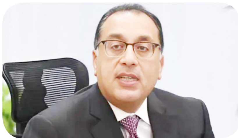
الدكتور مصطفى مدبولي رئيس الوزراء

ارتفع أسعار المواد الخام المستوردة، بعد تعويم الجنيه.