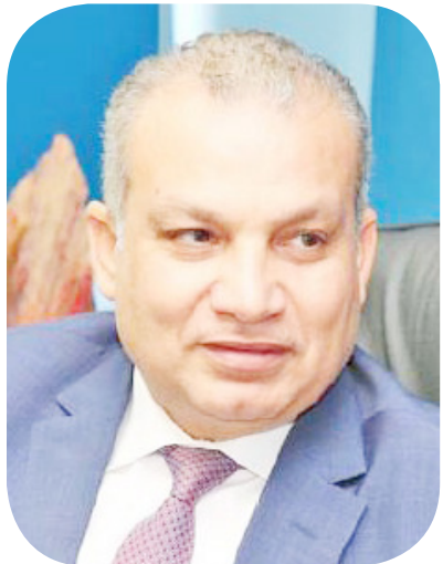
المهندس خالد صديق رئيس مجلس إدارة صندوق التنمية الحضرية

الأصول العقارية. وتبلغ استثمارات المشروع 6 مليارات جنيه، والمبيعات المتوقعة تتراوح بين 10 و12 مليار جنيه، فيما حققت المرحلة الأولى، التي تشمل 200 وحدة، مبيعات بقيمة مليار جنيه خلال 3 أيام، بحسب صديق.