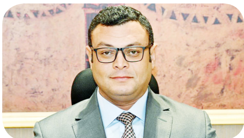
المهندس شريف الشربيني وزير الإسكان والمرافق والمجمعات العمرانية

وأورد بيان لوزارة الإسكان، أمس، عن المهندس شريف الشربيني قوله إن الوزارة تعمل من خلال هيئة المجتمعات العمرانية الجديدة على توفير المزيد من الأراضي الصناعية بسعر التكلفة، وتقديم كل الدعم للصناعات الوطنية، لافتاً إلى أنه جارٍ حالياً التنسيق بين الوزارات المعنية لتوحيد الجهة التي يتعامل معها المطور الصناعي. وطالب وزير الإسكان، المطورين العقاريين، خلال اللقاء، بوضع برامج زمنية محددة لإنهاء المشروعات الاستثمارية ومشروعات الشراكة بالمدن الجديدة، وتقسيم المشروعات إلى أجزاء