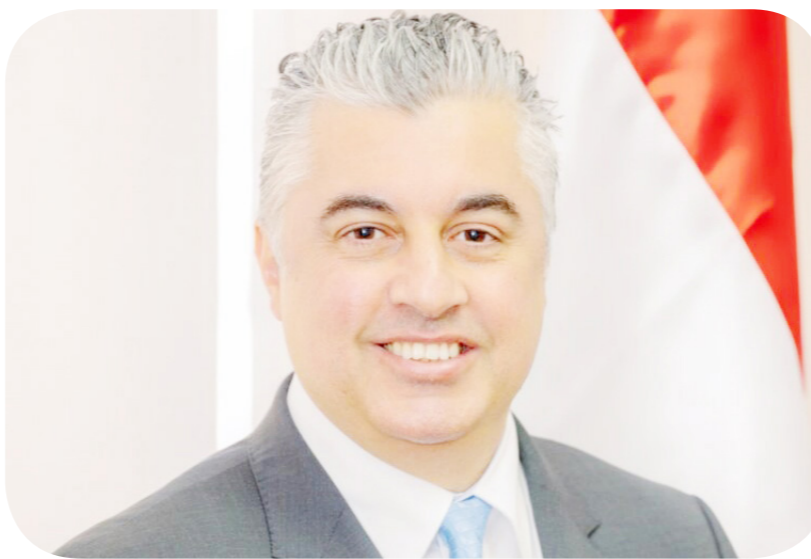
وليد جمال الدين رئيس الهيئة العامة للمنطقة الاقتصادية لقناة السويس

دولار، مقارنة بـ59 موافقة نهائية لمشروعات بقيمة 1.99 مليار دولار خلال العام المالي 2022/2023. وتابع: أن مشروعات الموانئ داخل المنطقة الاقتصادية لقناة السويس، بلغت خلال العام المالي الماضي، بلغت 7 مشروعات بتكلفة 1.359 مليار دولار، مقابل مشروعين فقط خلال العام المالي 2022/2023، بتكلفة استثمارية 30 مليون دولار. وتطرق جمال الدين إلى أن رأس المال المصدر لـ89 شركة تعاقدت على مشروعات في المناطق الصناعية بالمنطقة الاقتصادية لقناة السويس، بلغ خلال العام المالي الماضي، بلغ