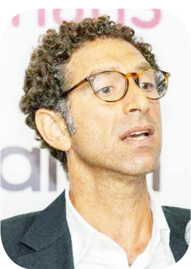
مدير نخلة المؤسس والرئيس التنفيذي لشركة Tam إن تي- حالا

40% من الحصة السوقية من نشاط التمويل بدولة تركيا في أعداد العملاء. وتابع: "سبب نجاح الشركة التركية اعتمادهم على التكنولوجيا المالية وإنشاء برنامج إلكتروني متخصص للتقييم الائتماني للعملاء"، مشيراً إلى أن هذا البرنامج يمكنهم من إصدار قروض شهرية بقيمة 50 مليون دولار شهريا عبر 39 فرعاً و700 موظف. ولفت المؤسس والرئيس التنفيذي إلى أن طرح شركة حالا في البورصة والحصول على رخصة بنك رقمي لا يزالان تحت الدراسة.