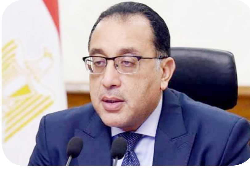
الدكتور مصطفى مدبولي رئيس الوزراء

موضحًا أن سعر البنزين سيجري بالكامل، مثل شرائح الكهرباء لمرتفعي الدخل. وأشار إلى تغطية دعم السولار وكهرباء محدودي الدخل عبر الفوائض المحققة من الشرائح العليا سواء في البنزين أو الكهرباء. وقال رئيس الوزراء إن زيادة الأسعار أصعب الملفات التي تتحرك فيها أي حكومة، مضيفًا أن أعينها على التضخم، وبالتالي: من الصعب تحريك الأسعار بصورة مفاجئة يصعب استيعابها. وتابع: "لذا يجري العمل على هذا الملف بصورة تدريجية، خاصة فيما يتعلق بترشيد الدعم"، مضيفًا أنه لا