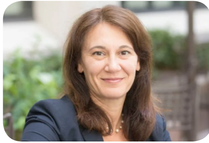
إيفانا فلادكوففا هولار رئيسة بعثة صندوق النقد الدولي في مصر

وقالت رئيسة بعثة صندوق النقد الدولي في مصر إن البرنامج المتفق عليه مع مصر يشمل التزامات لتعزيز وتحديث إجراءات