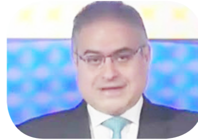
أشرف بهي الدين وكيل محافظ البنك المركزي للرقابة الداخلية