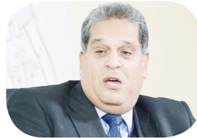
عاطف الشريف الشريك والمؤسس لشركة الشريف للاستشارات القانونية ورئيس البورصة المصرية الأسبق