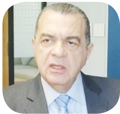
شريف الكيلاني نائب وزير المالية للسياسات الضريبية