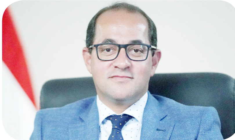
أحمد كجوك وزير المالية

إعادة ترتيب الأولويات بصورة تجعل الإنفاق العام أكثر مراعاة للبعد الاجتماعي