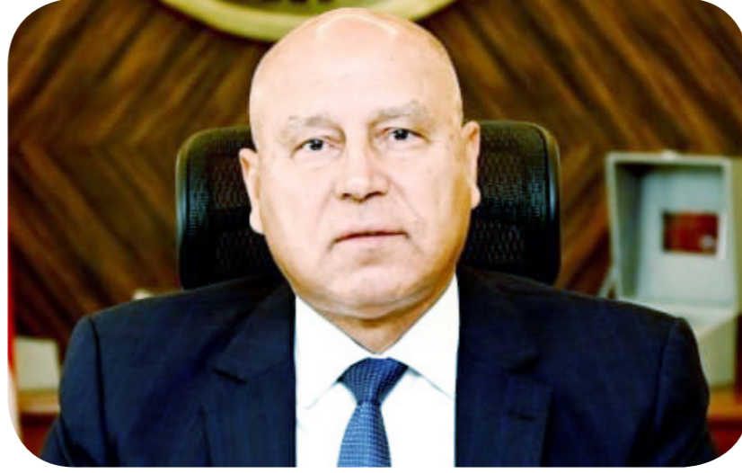
الفريق مهندس كامل الوزير نائب رئيس الوزراء للتنمية الصناعية وزير الصناعة والنقل

وأكد الوزير حرص الدولة على تعزيز دور القطاع الخاص بما يسهم في تعميق الصناعة المحلية، مشيرًا إلى العمل على إعداد خطة عاجلة للتهوض بهذا القطاع الواعد، والتي تستهدف سد الفجوة في السوق المحلية، وتوطين العديد من