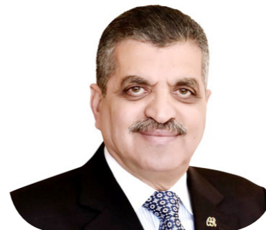
الفريق أسامة ربيع رئيس هيئة قناة السويس

بدرجة وزير، وذلك لمدة عام، اعتباراً من أمس، 12 أغسطس. وكان جمال الدين يشغل منصب المدير التنفيذي للهيئة الاقتصادية لقناة السويس من يناير 2020 ثم نائباً لرئيس الهيئة لشئون الاستثمار والترويج بقرار جمهوري صدر في مايو 2022، وصدر قرار