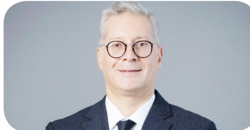
المهندس كريم بدوي، وزير البترول والثروة المعدنية

ويحد من الاستيراد، ويعمل على تقديم أفكار ونماذج جديدة للاستثمار في المشروعات البترولية. وأضاف أن هذه الشراكة تعمل على وضع آليات عمل قصيرة وطويلة المدى لمواجهة التحديات وتوفير بيئة استثمارية محفزة للمستثمرين لزيادة الإنتاج والقيمة المضافة. من جانبه، استعرض رئيس شركة "أبيك" أهم المشروعات التي تعمل فيها الشركة حالياً مع الشركات