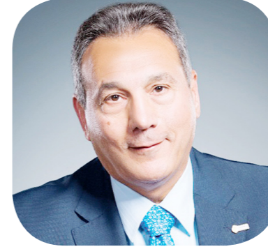
محمد الإترابي رئيس بنك مصر