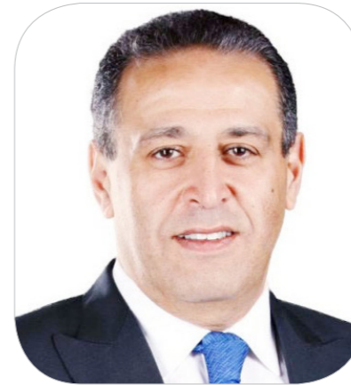
أشرف سالماني وزير الاستثمار الأسبق

أكثر فاعلية لرفع كفاءة السوق المحلية، وكذلك تعظيم الاستفادة من أصول وامكانيات شركة مصر للمقاصة. وشدد مصطفى فوزي العضو المنتدب لشركة إسباير كابيتال للاستثمارات المالية - المرشح على مقاعد السمسرة- على ضرورة توفير إمكانية الاقتراض لمصر للمقاصة لزيادة العائد على الاستثمارات، وتعظيم الاستفادة من الأصول المتاحة، وكذلك العمل على تقليل مكافآت مجلس الإدارة في ظل بلوغها مستويات اثارته انتقاد عدد كبير