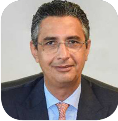
الدكتور شريف فاروق وزير التموين والتجارة الداخلية

برنامج الحكومة المصرية في المحافظة علي وجود احتياطي استراتيجي آمن من السلع الأساسية، ومن أهمها القمح لضمان توفير الكميات اللازمة من الدقيق التمويني